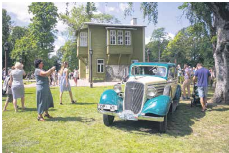
Muzeja apkārtnē senatnīgu noskaņu radīja retroautomobiļu ierašanās.