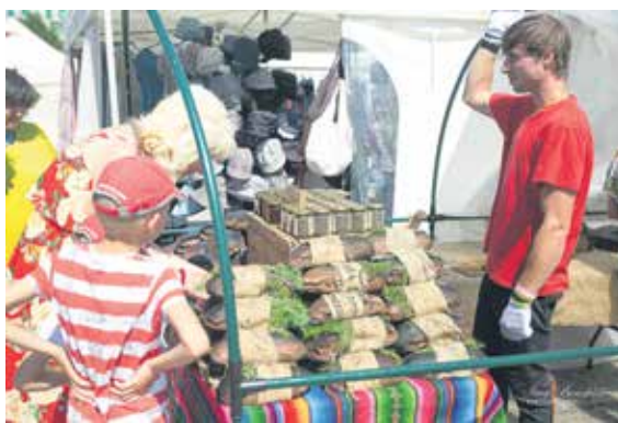
Amatnieku tirgus šogad norisinājās Pilsētas laukumā. Te varēja nopirkt gan ēdamas lietas, gan rotas, apģērbus un daudz ko citu.