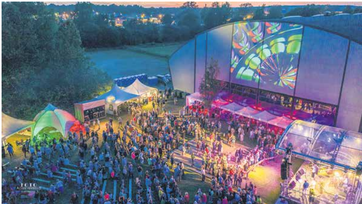
Māras dīķa apkaime pie vieglatlētikas manēžas bija pārtapusi līdz nepazīšanai. Te darbojās divas skatuves, tika piedāvātas dažādas nodarbes gan bērniem, gan pieaugušajiem. Kad satumsa, dīķis kļuva par mājvietu krāšņām muzikālām strūklakām.