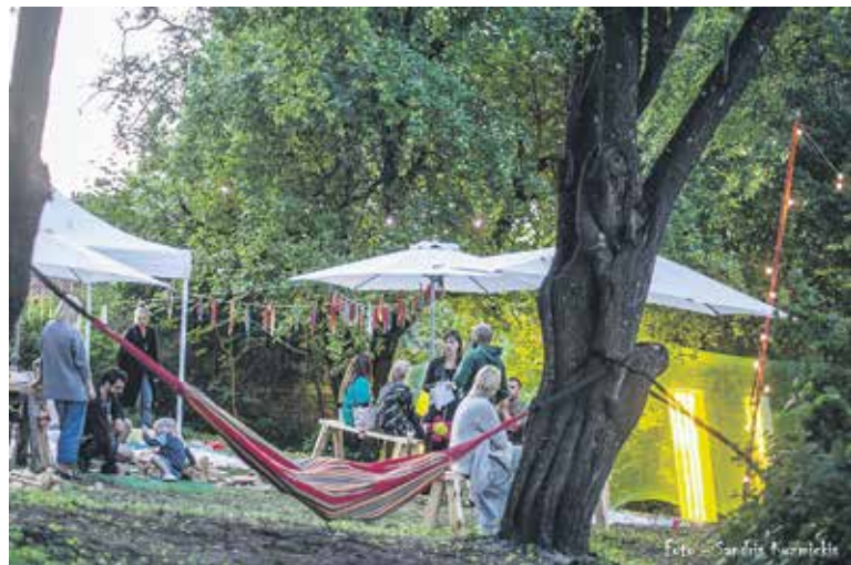
“Baltās mājas” jeb Kaļķu ielas 3 pagalmā valdīja mierīga noskaņa, varēja baudīt izbraukuma kafējnīcas “Piens” piedāvājumu, pagulēt šūpuļtīklā, piedalīties radošās nodarbēs un klausīties koncertus.