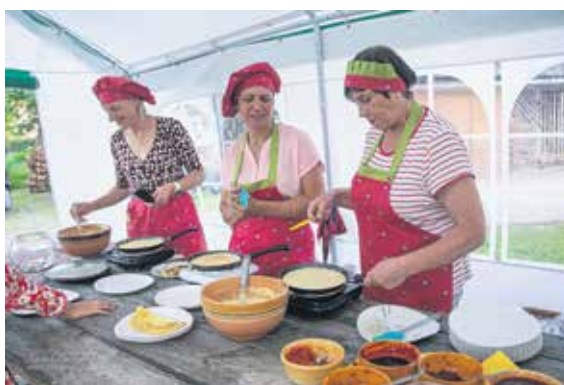
Sv. Annas baznīcas draudzes dāmas arī šogad cepa gardas pankūkas, ko varēja baudīt apmaiņā pret ziedojumu baznīcas jumtam.