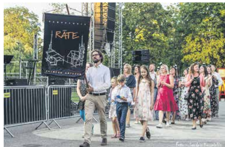
Arī šogad svētku gājienā bija daudz atraktīvu un izdomas bagātu dalībnieku. Par atraktīvākajiem gājiena dalībniekiem žūrija atzina Kuldīgas ugunsdzēsējus, par spilgtākajiem – laikraksta “Kurzemnieks” kolektīvu, jauno kuldīdznieku gods šogad tika “Viva fitness” komandai, muzikālākie kuldīdznieki bija no kamerkora “Rāte”, bet sirsnīgākie – no bērnu izklaides un pieskatīšanas centra “Brīnumzeme”.