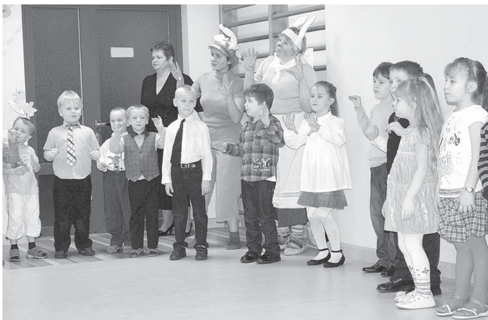
Svētku koncerti, kuros ar priekšnesumiem savus vecākus priecēja bērni, notika 8. un 9. februārī.

Kuldīgas pirmsskolas izglītības iestāde „Cīrulītis” 7. februārī svinēja 40 gadu jubileju.