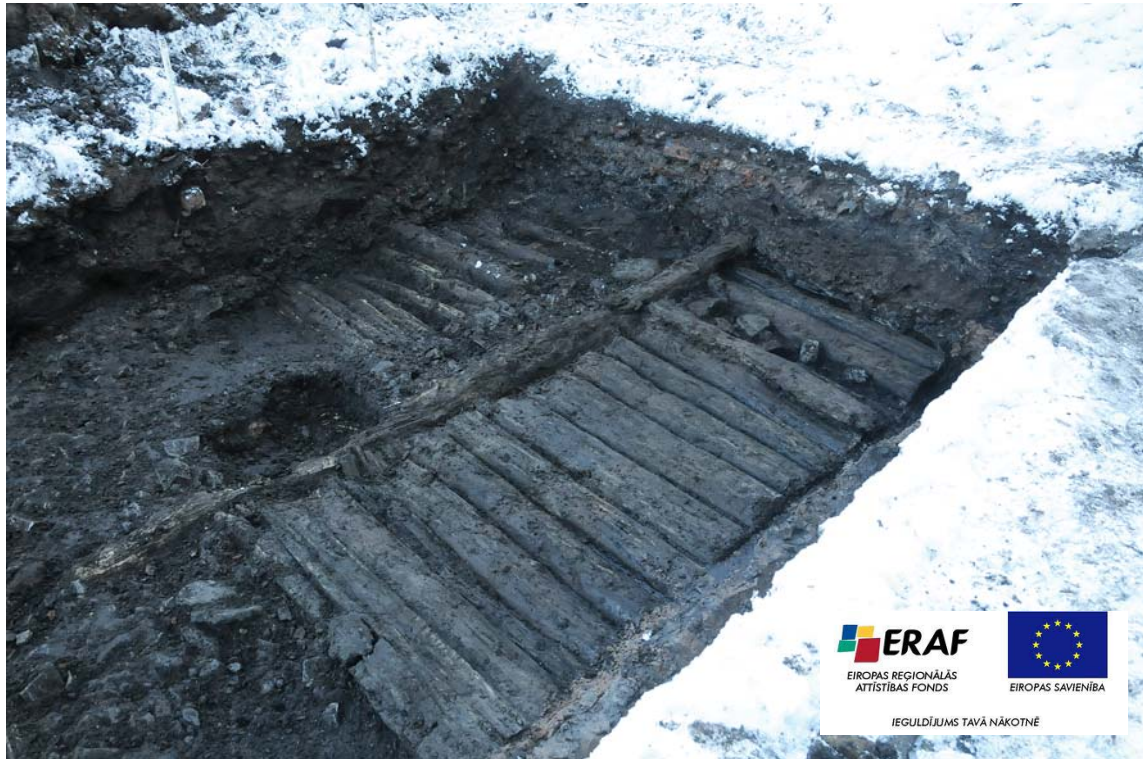
Guļbaļķu ielas klājums, domājams, veidots 13. gadsimta beigās, 14. gadsimtā. No baļķiem paņemtos paraugus pētīs LU Latvijas Vēstures institūtā, lai noteiktu precīzu vecumu.

ANITAS ZVINGULES teksts