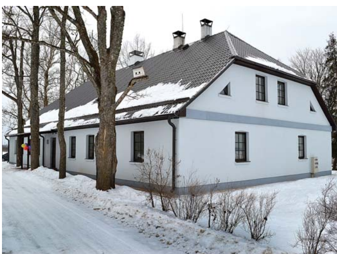
Vārmes sociālā māja „Dūru skola” pēc atjaunošanas.