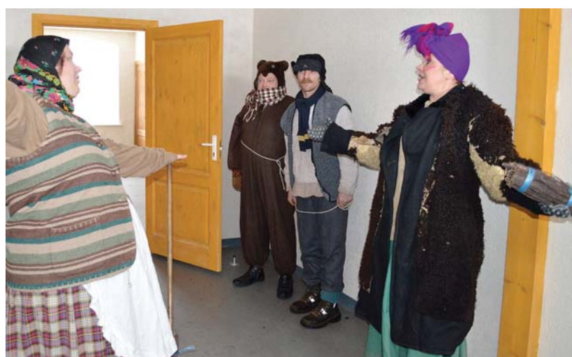
Laimis lācis ar pavadoņiem sagaida viesus sociālajā mājā „Dūru skola”.

22. februārī notika svinīga sociālo māju atklāšana Snēpelē un Vārmē, kuras pēc rekonstrukcijas ir nodotas iedzīvotājiem lietošanā.