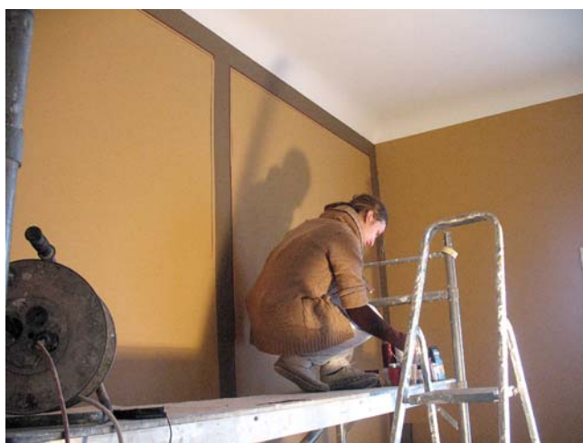
Kuldīgas novada muzejā sāka sienu dekoratīvo gleznojumu restaurācija.