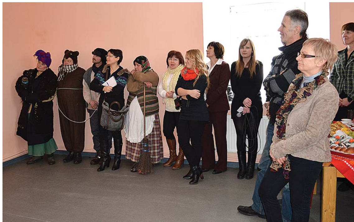
Klātesošie tiek iepazīstināti ar sociālās mājas „Dūru skola” būvniecības gaitu.

Rekonstrukcijas laikā ēkām tika nosiltinātas fasādes un cokoli, bēniņi un pagrabu pārsegumi, no-