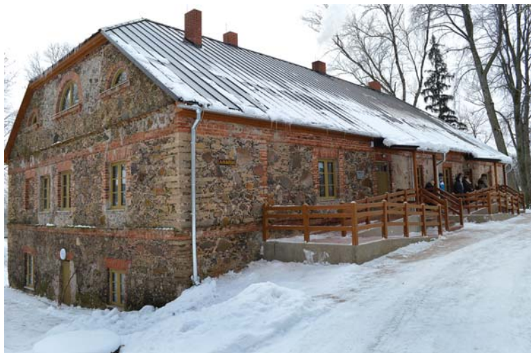
Renovētā sociālā māja Snēpelē „Arkādijas”.