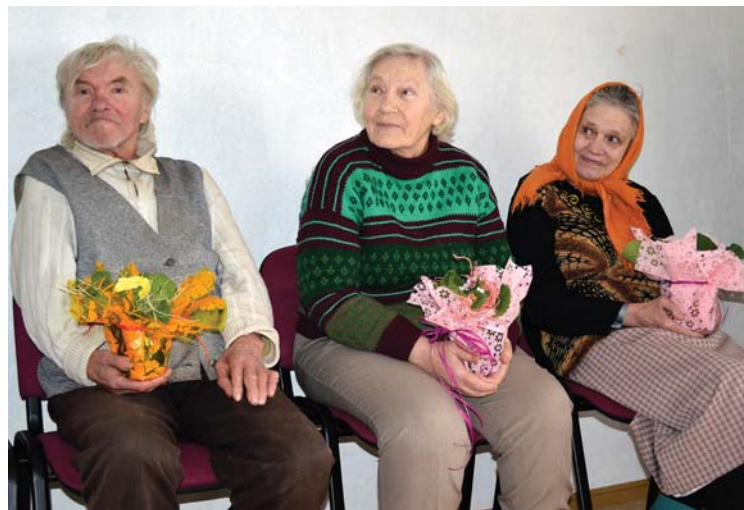
Sociālās mājas „Arkādijas” iedzīvotāji priecājas par paveikto.