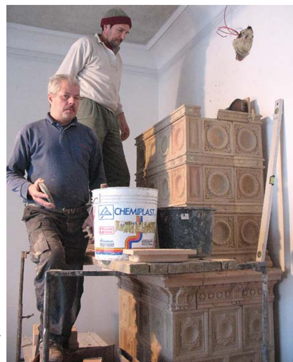
Bangerta villā tiek atjaunotas arī krāsnis.

2012. gada jūnijā projekta „Kuldīgas novada muzeja rekonstrukcija un interjera restaurācija” ietvaros tika sāta muzeja atjaunošana. Šobrīd noslēdzies apjomīgs darbs pie sienu un grīdas vēsturisko krāsojumu izpēti.