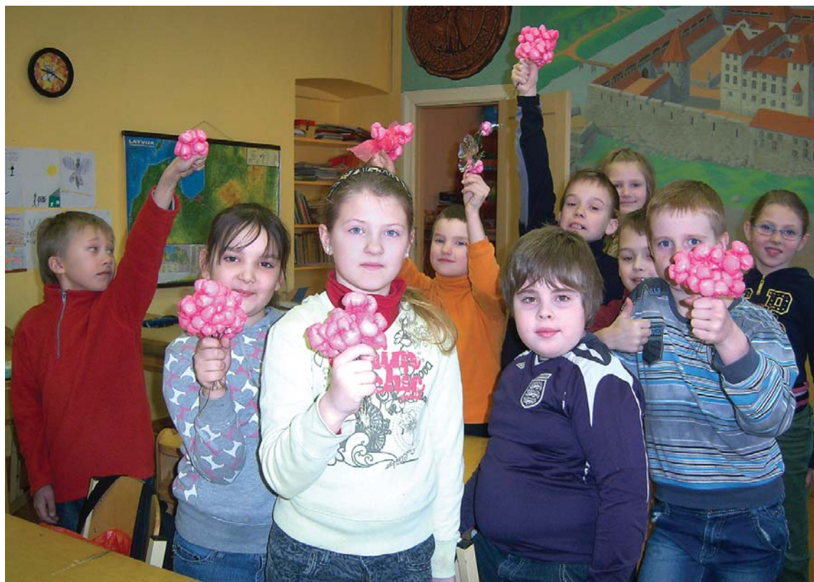
Radošā darbnīca Kuldīgas pamatskolas 3. klasē – izgatavoti ābeles pumpuri no polietilēna maisiņiem.

Lielās Lieldienu šūpoles šajā pavasarī būs divās vietās pilsētā – Pilsētas dārzā un estrādē.