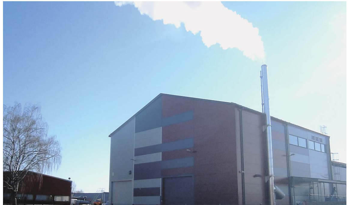
Koģenerācijas stacija dod papildu līdzekļus, lai samaksātu par šķeldas iepirkumu katlumājai.

Otrkārt, rēķinu par siltumu ietekmē āra gaisa temperatūra. Pieredze rāda – jo zemāka gaisa temperatūra, jo iedzīvotājiem lielāks