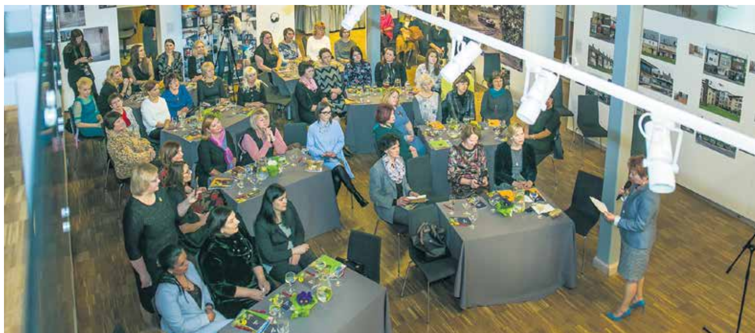
21. martā domnīcā “Līderes kods” bija pulcējušās ap 40 uzņēmīgas sievietes mūspusē, lai pasākuma gaitā noskaidrotu, kādas ir Kuldīgas novada uzņēmīgo sieviešu svarīgākās vērtības.

21. marta pievakarē Kuldīgas Mākslas namā, biedrības “Līdere” un pašvaldības uzrunātas, domnīcā “Līderes kods” bija pulcējušās ap 40 uzņēmīgas sievietes mūspusē, lai sirsnīgā gaisotnē dalītos sev svarīgās vērtībās, dzīves un darba pamatprincipos un pasākuma gaitā noskaidrotu, kādas ir Kuldīgas novada uzņēmīgo sieviešu svarīgākās vērtības.