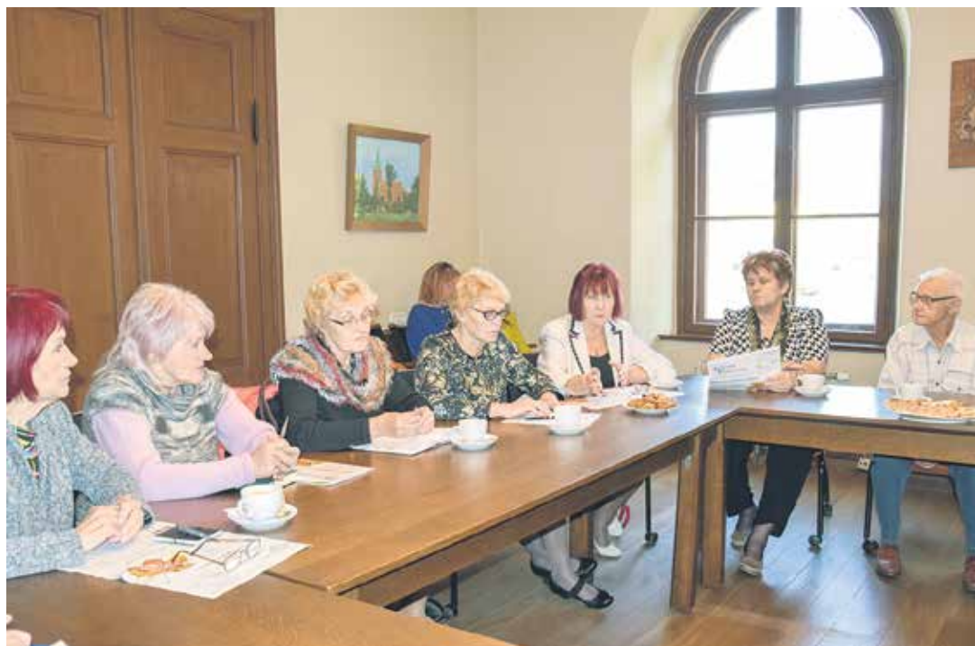
Uz pirmo senioru padomes sēdi sanāca jaunā sasaukuma locekļi, kuri turpmāk virzīs idejas senioru dzīves kvalitātes uzlabošanai.

Seniori no "Rumbiņas" pateicās par pašvaldības pretimnākšanu, nodrošinot telpas, kur biedriem darboties dažādās