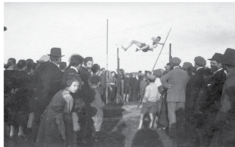
Kārtslēkšanas sacensības Kuldīgā, aptuveni 1920. gads.

“Kā tur īsti bija?” ir pasākumu cikls par atsevišķu vietu un notikumu vēsturi Kuldīgā un novadā.