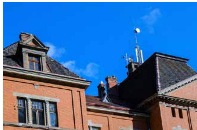
Pelču pils jumts.

Pelču pilī, ko apdzīvo Pelču speciālās internātpamatskolas–attīstības centra audzēkņi un pedagogi, septembrī sākta jumta sakārtošana, kas pakāpeniski norisināsies līdz pat aprīlim. Pērn Pelču pilī sakārtotas ieejas kāpnes dienvidu pusē.