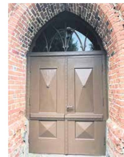
Ēdoles baznīcas durvis.