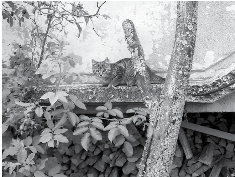
Turpmāk klaiņojošos dzīvniekus, kuri tiks notverti, vedīs uz Saldus dzīvnieku patversmi "Oposums", kur saimnieks tos varēs atgūt.

Dzīvniekiem mikroshēma satur unikālu ciparu kodu, ko var nolasīt