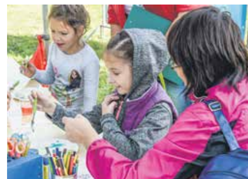
Ar zīmēšanas un krāsošanas palīdzību radošajā darnīcā "Tu esi tas, ko tu ēd" mazākie pasākuma dalībnieki izprata pareiza uztura nozīmi ikdienā.