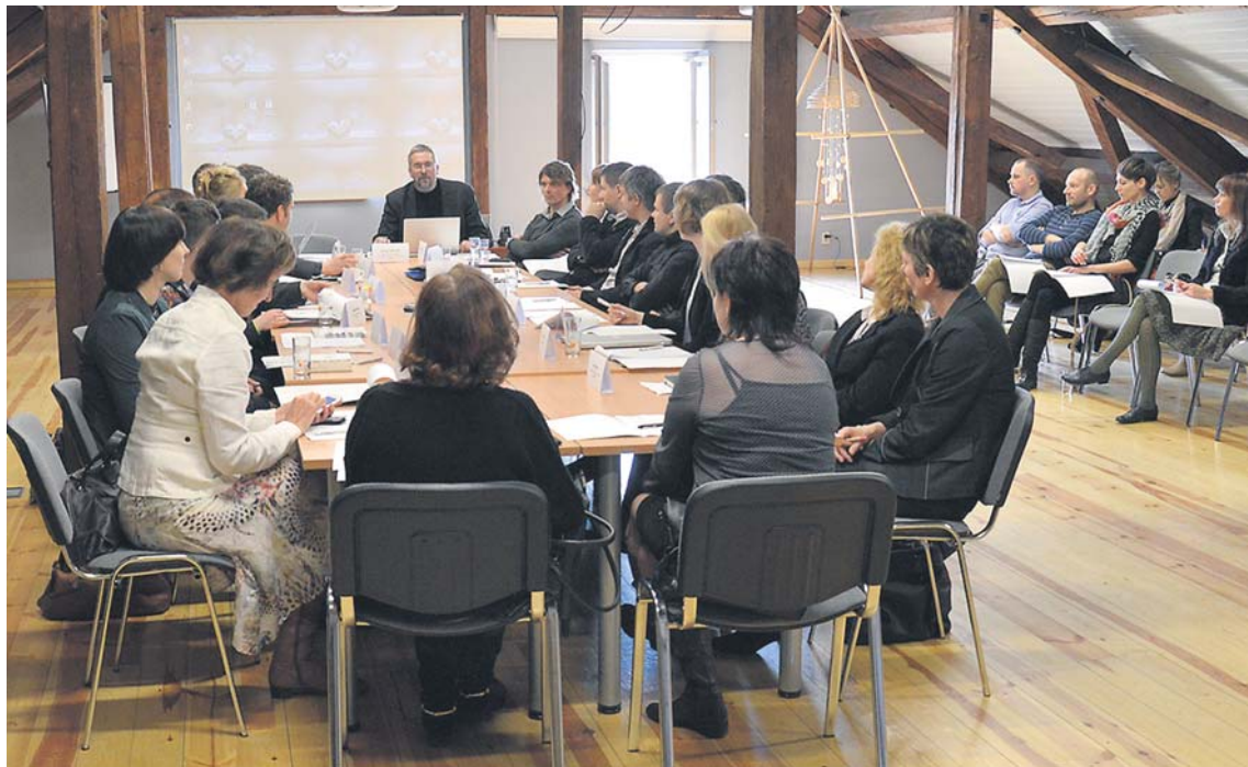
Diskusijā piedalījās dažādu uzņēmumu pārstāvji, kuri bija gatavi iesaistīties radošo industriju izglītības veicināšanā.