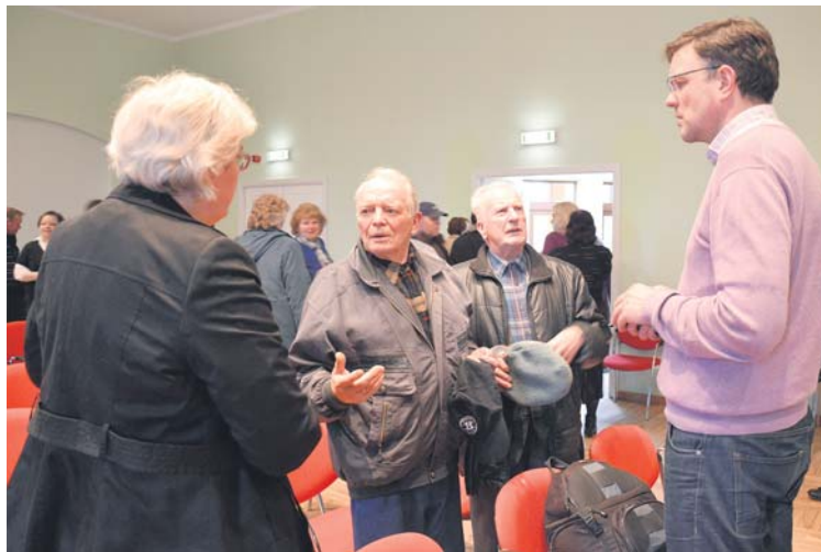
Rendas pagasta iedzīvotāji, tiekoties ar novada pašvaldības vadību un pārstāvjiem, interesējās par jaunumiem un izmaiņām komunālajā saimniecībā.

Daudzus satrauc atkritumu šķirošana un izvešana. Pārstāvji ieteica mājas iedzīvotājiem vieno-