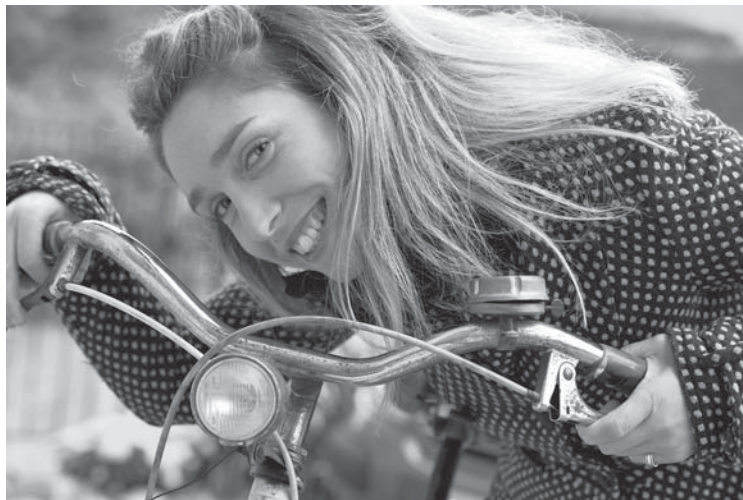
Šogad velofestivāla jaunums būs radošā darbnīca „Esi radošs un drošs”.

Reģistrācija notiek gan dienas, gan nakts braucienam, un, tāpat kā