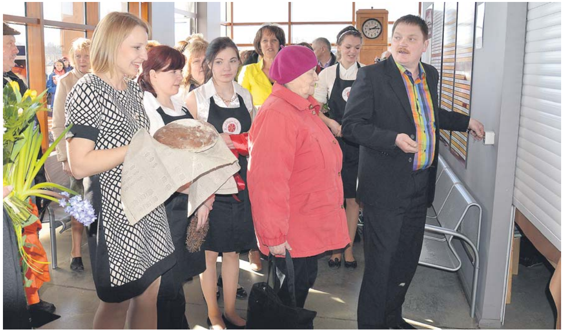
Svinīgi atvērts, savus pircējus gaida mājražotāju un zemnieku produktu veikals „Kuldīgas labumi”, kurā ir iespēja iegādāties dabīgas un veselīgas preces.

Informējam, ka mājražotāju veikals atrodas Adatu ielā 9, Kuldīgā, jaunās autoostas telpās. Darba laiks: otrdienās, trešdienās, ce-