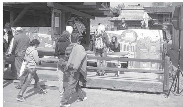
Spēle notiks 20. maijā 11.00 – 12.30 Kuldīgas vecpilsētā.

Jāpiebilst, ka „Kuldīgas vecpilsēta Ventas senlejā” ir neatkārtojams vienots ansamblis, kādam līdzīga nav ne Latvijā, ne citviet Eiropā vai pasaulē. Kuldīgas novada pašvaldībai mērķtiecīgi darbojoties, kopš 2004. gada Kuldīgas vecpilsēta Ventas senlejā ir iekļauta UNESCO Pasaules mantojuma Latvijas nacionālajā sarakstā, un tālākais mērķis ir iekļaut to Pasaules mantojuma sarakstā. Vienota ansambļa „Kuldīgas vecpilsēta Ventas senlejā” sagatavošanās iekļaušanai UNESCO Pasaules mantojuma sarakstā ir iespējama vienīgi ar katra iedzīvotāja aktīvu līdzdalību. Tādēļ tiek rīkota