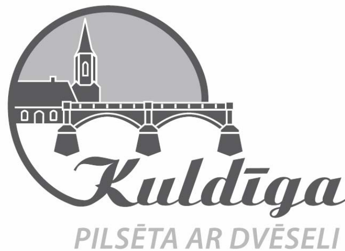
Lindas Liņķes logotips saņēma veicināšanas balvu.

Izvērtējot iegūto informāciju Kuldīgas mājas lapā un komisijas locekļu priekšlikumus, Kuldīgas novada Dome nolēmusi neatzīt par uzvarētāju nevienu no atklātajā ideju konkursā „Kuldīgas logotipa izstrādāšana” iesniegtajiem logotipiem.