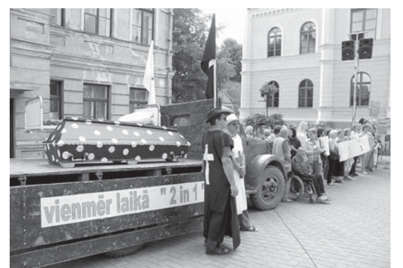
Kravas automašīna simbolizēja, kā taupības apstākļos var ietaupīt līdzekļus, apvienojot medicīnas un apbedīšanas pakalpojumus. Vizuālo iespaidu papildināja dziesma „Balts zārks ar melnām pumpām”.