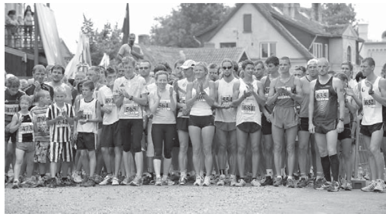
6. SEB Kuldīgas pusmaratonā šogad startēja vairāk nekā 1000 skrējēju.