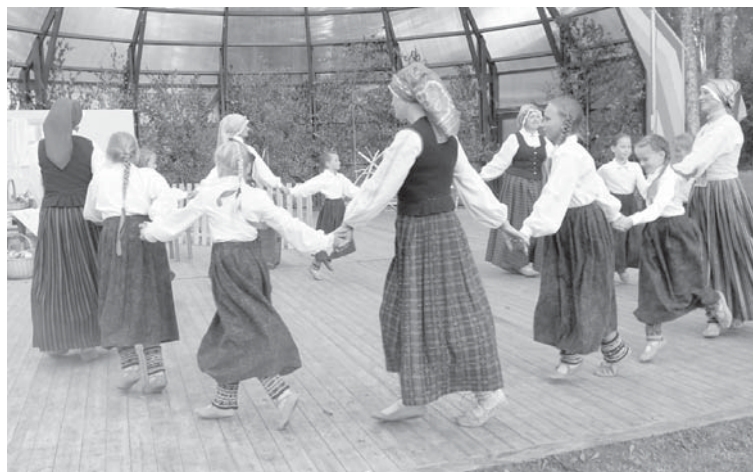
Kuršu ķoniņdienā ar tautas dejām priecēja Turlavas skolas bērņi kopā ar mammām.

Pēcpusdienā estrādē notika teātra izrāde „Ķoniņu brīvības skaņa”, ko iestudēja 20 Turlavas iedzīvo-