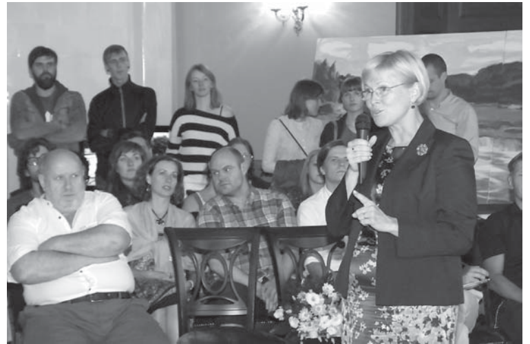
Prezentāciju vakarā „Pecha Kucha” uzstājās arī LR kultūras ministre Žaneta Jaunzeme-Grende, kura stāstīja par uzdrīkstēšanos un ticību savām idejām.