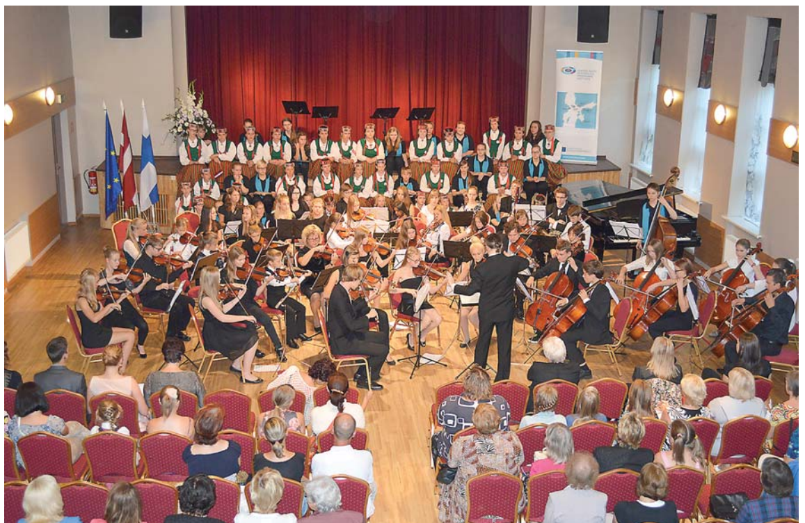
Koncertā piedalījās Kuldīgas mūzikas skolas kamerorķestris un saksofonistu ansamblis, Hivinkā Mūzikas institūta orķestris, abu skolu apvienotais flautistu oktets un kori.