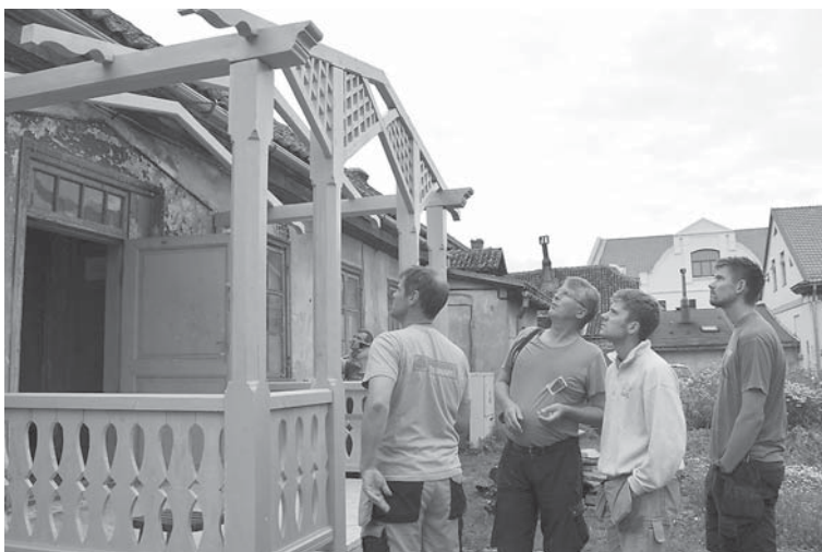
Restaurācijas darbnīcas dalībnieki aplūko ēkas Raiņa ielā 6 verandas atjaunošanu.

Amatnieki no Drebakas Kuldīgā strādāja pie logu komplektu atjaunošanas un nozīmīgiem restaurācijas darbiem ēkai Raiņa ielā 6, kas turpmāk kalpos kā lielisks restaurācijas piemērs tam, kā korekti jāveic būvniecība, izmantojot tradicionālās metodes un materiālus.