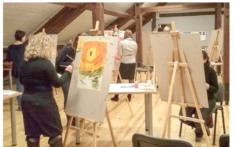
Ikviens interesents kursos darbojas atbilstoši savai gatavības pakāpei un temperamentam.

Vizītes laikā ministre apskatīja Kuldīgas Mākslinieku rezidenci, kuras izveide uzsākta šī gada jan-