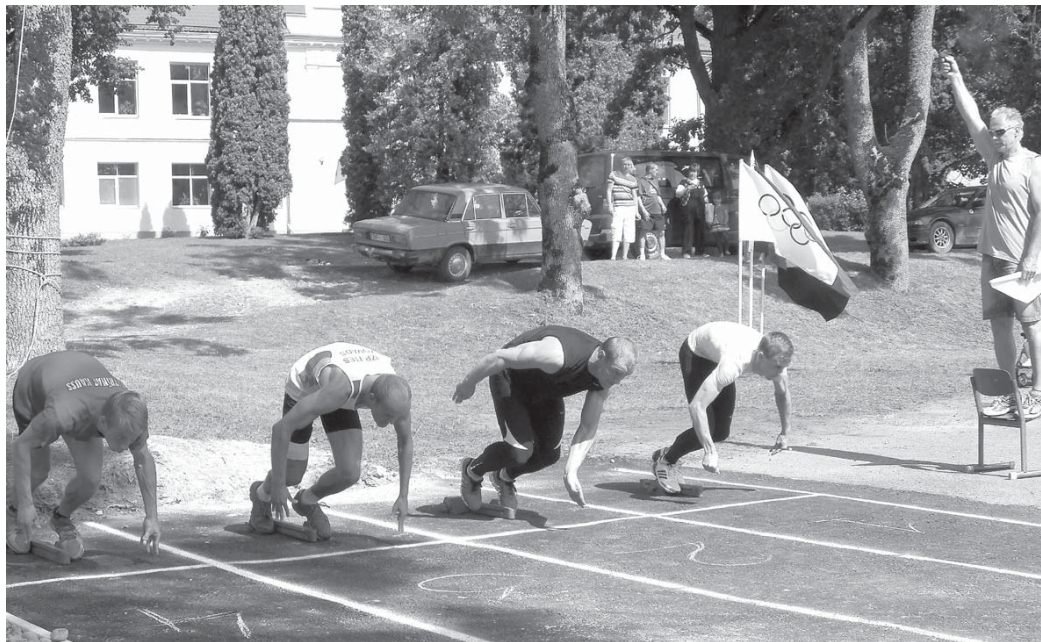
Dalībnieki ņem startu 100 m fināla skrējienam.