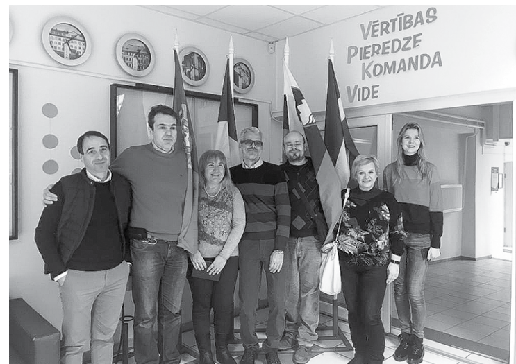
Erasmus+ projektā "GREEN – enterprise" iesaistītie pedagogi pie savu valstu karogiem V. Plūdoņa Kuldīgas vidusskolā.

Mācību vizītes laikā ārvalstu skolotāji iepazinās ar skolēniem, kuri projektā pārstāvēs V. Plūdoņa Kuldīgas vidusskolu. Tie būs 10. a