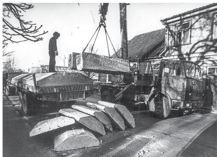
Kuldīgai 1991. gada barikāžu notikumos bija īpaša loma. Sargājot pasta ēku, barikāžu dalībnieki to bija nocietinājuši ar lieljaudas tehniku, betona bluķiem un dzeloņdrātīm.

AGATE ŪDRE, Kuldīgas novada bērnu un jauniešu centra pasākumu organizatore