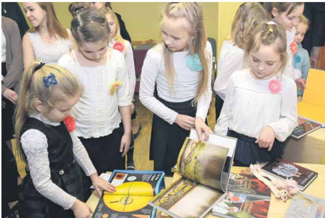
Vilgāles pamatskolas bērni priecājās par deputātu dāvinātajām grāmatām Draudzīgā aicinājuma dienā.

Iepriekšējos gados Draudzīgā aicinājuma dienā Kuldīgas novada Domes deputāti grāmatas dāvinājuši pirmsskolas izglītības iestādei “Cīrulītis”, V. Plūdoņa Kuldīgas