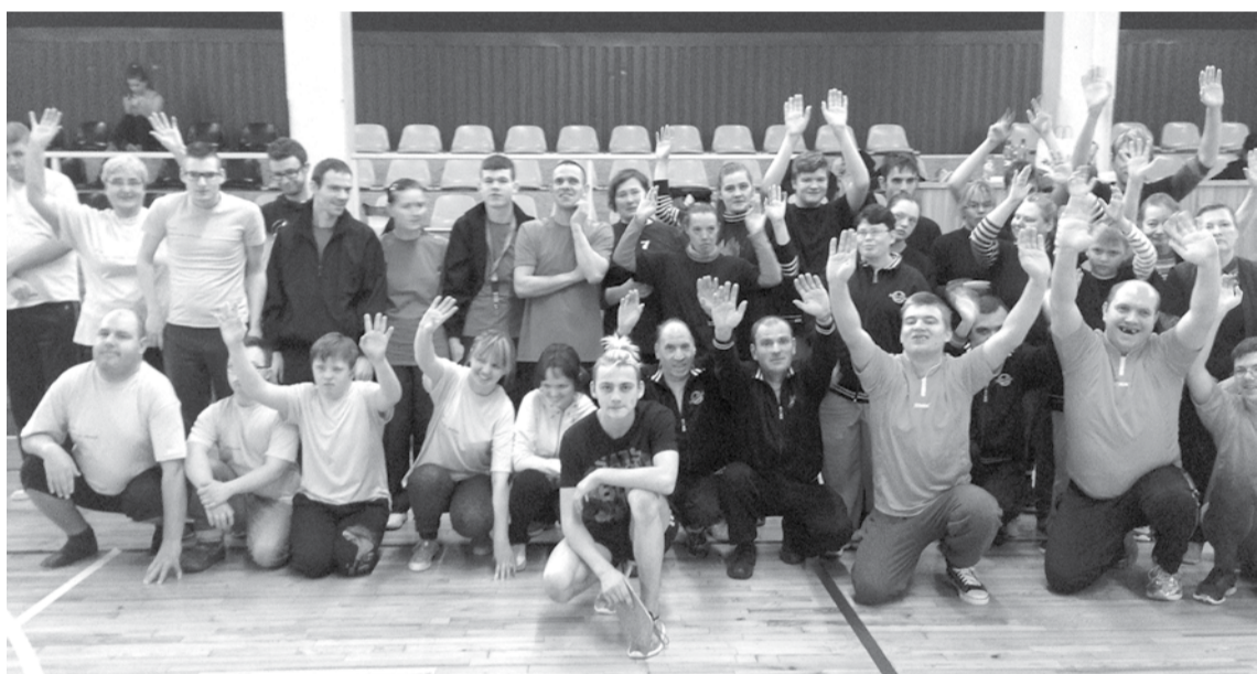
Sacensībās "Kurzemes "Boccia" kauss 2017" piedalījās deviņas komandas no dažādām Kurzemes pilsētām.

SIGNETA LAPIŅA, sabiedrisko attiecību speciāliste