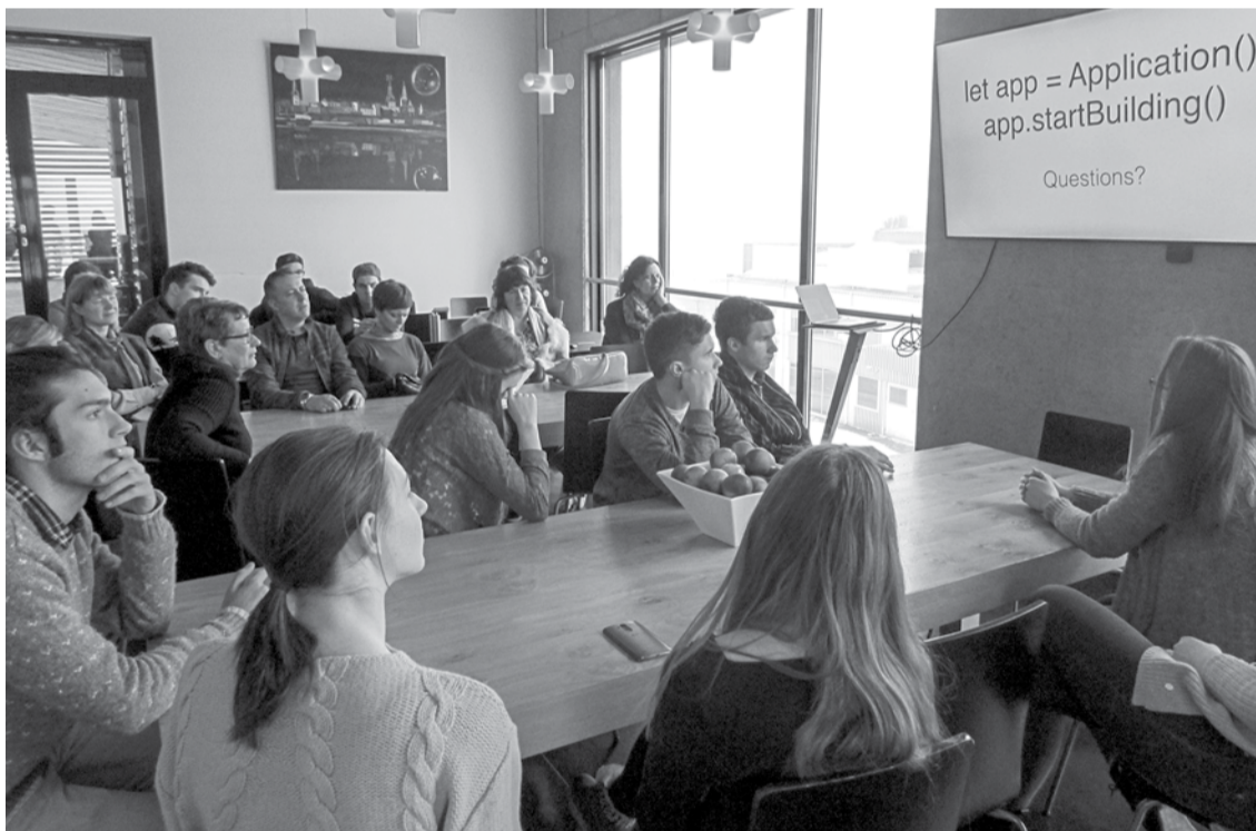
V. Plūdoņa Kuldīgas ģimnāzijas skolēni un citi “Erasmus+” projekta “EU – preneurs” dalībnieki viesojās birojā “Draugiem.lv”.

No 16. līdz 20. janvārim V. Plūdoņa Kuldīgas ģimnāzijā norisinājās ceturrtā mācību sesija “Erasmus+” projekta “EU – preneurs” ietvaros, kuras laikā 12 skolēni no Latvijas, Igaunijas, Beļģijas un Slovēnijas skolām nedēļu pavadīja kopā mācoties, strādājot un aizraujoši pavadot laiku.