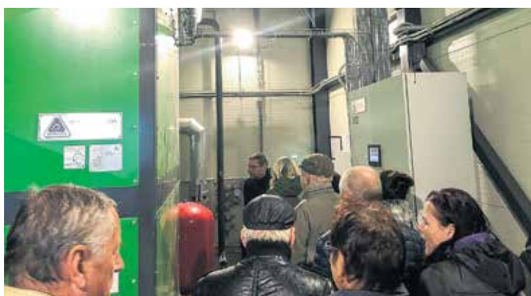
Ekskursijas dalībnieki paviesojās jaunajā Priedaines katlumājā, kas nodrošina apkuri apkārtnes iedzīvotājiem.

Bija iespējams apskatīt atjaunoto Dārzniecības ielu un no jauna uzbūvēto Meistaru ielu, kas