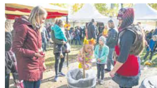
Rūķi gadatirgū rosījās, piedāvājot apgūt jaunas un dzīv noderīgas prasmes, piemēram, skābēt kāpostus.