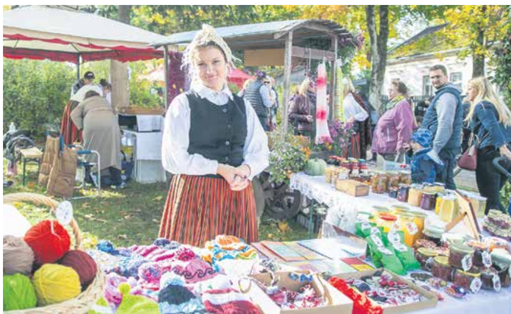
Laidu pagasta stendā bija daudz dažādu preču. Varēja pagaršot un arī iegādāties pikantu piedevu gaļai, kas gatavota no dzērvenēm, medus un ķiplokiem.