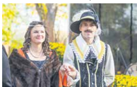
Gadatirgū cēli pastaigājās un ar pasākuma viesiem labprāt fotografējās pats Kurzemes hercogs Jēkabs ar hercogieni Luīzi Šarloti.