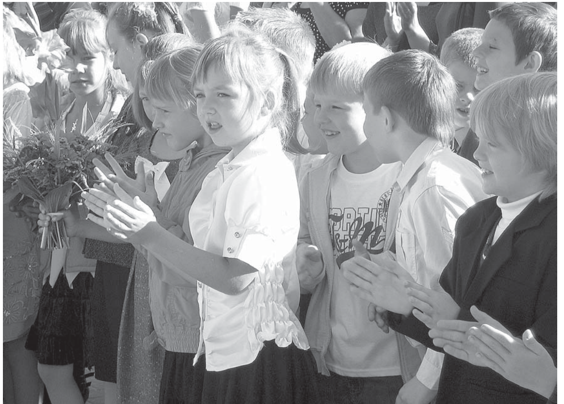
1. septembris ir svētku diena arī Kuldīgas Centra vidusskolas skolēniem.

2010./2011. mācību gada pirmais semestris ilgs no 1. septembra