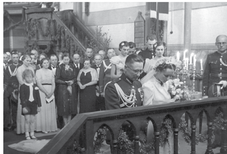
Kāzas Sv. Annas baznīcā ap 1930. gadu.

„Dzīves godos” iekļautas dažādu laiku fotogrāfijas un tradīciju rak-