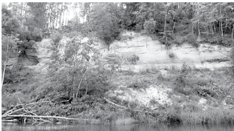
Abavas senlejai izstrādāts jauns dabas aizsardzības plāna projekts, ko iedzīvotāji aicināti izzināt un apspriest.

Dabas parkā „Abavas senleja” ir veikta ainavas un dabas vērtību izpēte, tajā skaitā apsekoti zālāji, nosakot to atbilstību botāniskajiem bioloģiski vērtīgajiem zālājiem. Pēc 2015. gada zālāju inventarizācijas noteikti atbilstoši Eiropas Savie-