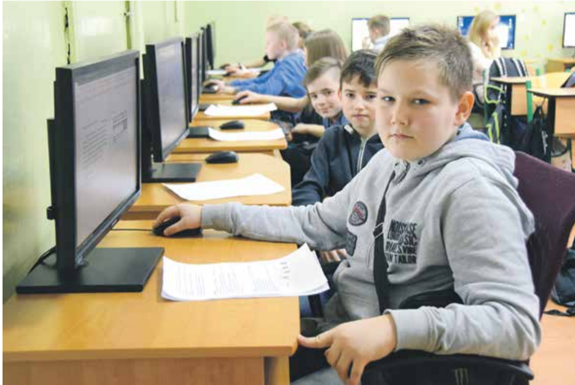
Kuldīgas 2. vidusskolas audzēkņi datorprasmes un programmēšanu apgūst, izmantojot pašvaldības iegādātos datorus un jaunāko programmatūru.