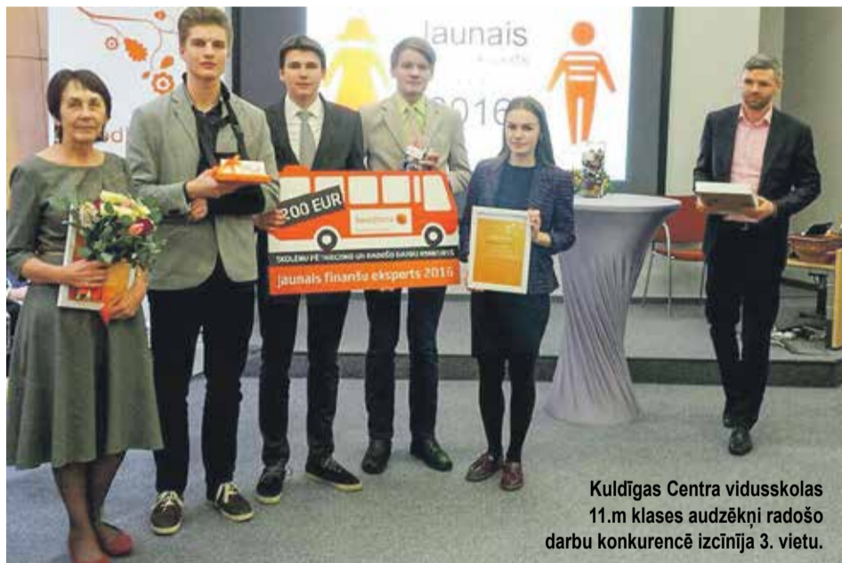
Kuldīgas Centra vidusskolas 11.m klases audzēkņi radošo darbu konkurencē izcīnīja 3. vietu.

Kuldīgas Centra vidusskolas komanda ieguvusi 3. vietu 59 komandu konkurencē pētniecisko un radošo darbu konkursā „Jaunais finanšu eksperts 2016”.