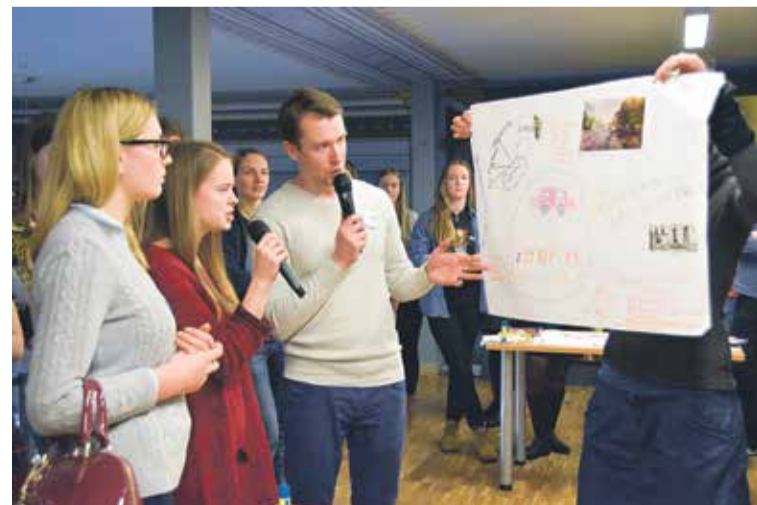
Nometnē „Telpas pavasaris” jaunieši radoši atainoja, kā ikdienā saudzēt vidi.

Projekta „Telpas pavasaris” mērķis ir veikt pētījumu par to, kā Latvijas