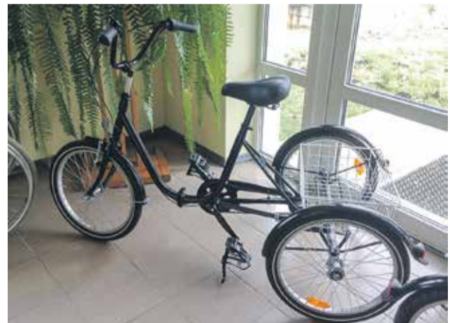
Par saziēdotu naudu iegādāti velosipēdi bērniem ar īpašām vajadzībām.

Lūgšanu brokastu viesu saziēdotie līdzekļi nonāca Pelču speciālās internātpamatskolas-attīstības centra rīcībā. Par saziēdotu naudu skola iegādāsies Latvijā ražotus trīsriteņus,