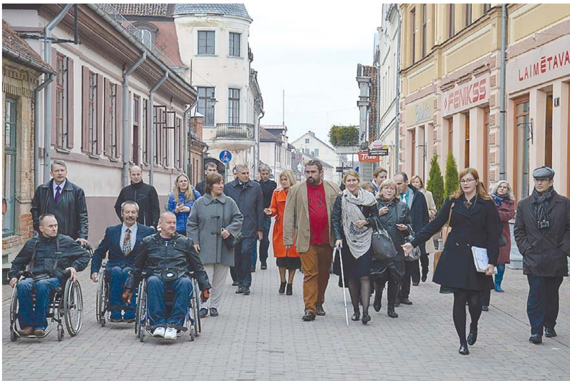
Eksperti un cilvēki ar invaliditāti, kas piedalījās konferencē, secināja, ka Kuldīga ir gatava meklēt risinājumus un darīt visu, lai ikviens pilsētā justos kā mājās.