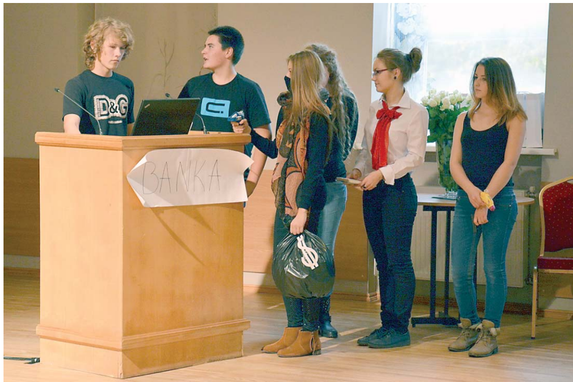
Karjeras nedēļā Kuldīgas pamatskolas 9. klases skolēni prezentācijā par profesijām iejutās banķieru lomā.