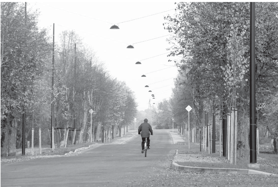
Ekspluatācijā nodota Stendes iela, kur projekta ietvaros pazemināta ielas virskārta, izbūvēta betona bruģakmens brauktuve, rekonstruētas autobusa pieturas un citi vērienīgi darbi.

izveidota 1,50 m grantēta mala automašīnu novietošanai.