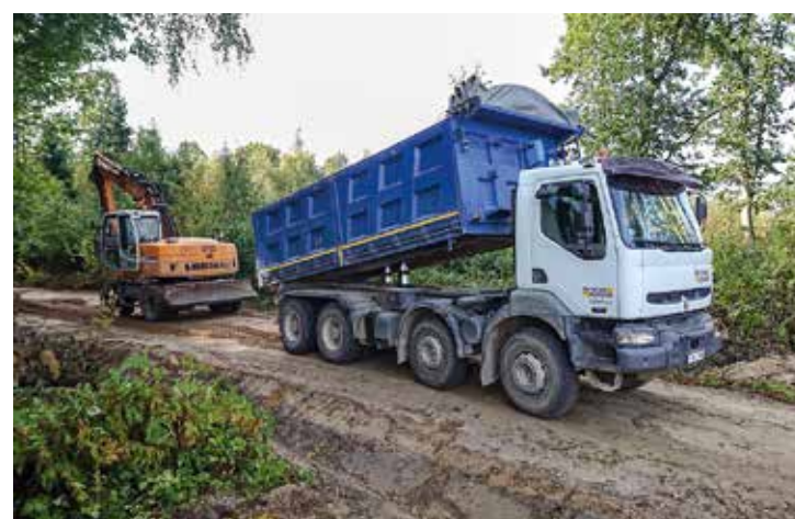
Turlavā sakārtoti vairāki ceļa posmi, tostarp Kazlēnciema ceļš, kur izrakti grāvji, atjaunots segumu un izbūvēta caurteka.

Turlavas pagasta pārvalde šogad realizējusi vairākus nozīmīgus darbus, lai uzlabotu pagasta infrastruktūru. Visapjomīgākais darbs tika paveikts Ķikuru ciematā, kurā izbūvēja ielas apgaismojumu. Šos darbus veica SIA "CVS", un tie izmaksāja 18 000 EUR. Ne mazāk vērienīgi bija Kazlēnciema ceļa remontdarbi, kur raka grāvjus, atjaunoja segumu un izbūvēja caurteku. To paveica SIA "ICU projekti", darbu izmaksas bija 9600 EUR.