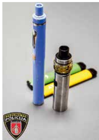
Attēlā redzamas konfiscētās e-cigaretes, kas izņemtas vienā no Kuldīgas novada skolām.