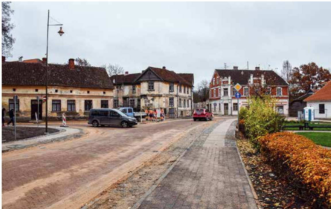
Jelgavas ielā un ar to saistītajās ielās pēc apjomīgajiem remontdarbiem atjaunota autotransporta un arī sabiedriskā transporta satiksme. Būvdarbus pilnībā plānots pabeigt līdz 10. decembrim.

1. novembrī pēc gandrīz pusotra gada ilgušiem būvdarbiem un dažādiem satiksmes ierobežojumiem sakarā ar Jelgavas ielas un ar to saistīto ielu pārbūvi satiksmei tika atvērti pārbūvētie ielu posmi. Būvdarbi objekta turpināsies, bet ierobežojumi būs lokāli un īslaicīgi.