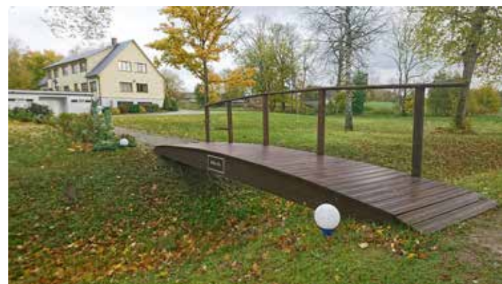
Turlavas Dižgaiļu parka estrādes apkārtnē uzstādīti trīs jauni gājēju tiltiņi.