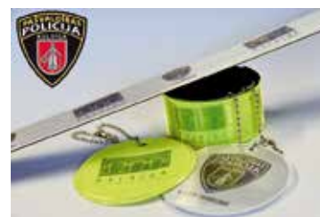
Pašvaldības policija sagādājusi skolēniem atstarotājus, lai atgādinātu par drošību uz ceļa diennakts tumšajā laikā.

Pašvaldības policija lūdz vecākiem veikt pārrunas ar bērniem un atgādināt, kā šķērsot ceļu un kā uzvesties brauktuves tuvumā. Arī brīžos, kad bērns ielu šķērso uz gājēju pārejas, atgādināt bērnam pārliecināties, vai automašīna ir pilnībā apstājusies. Tāpat pašvaldība vecākiem lūdz nodrošināt vismaz vienu atstarotāju – pielikt to pie bērna mugursomas vai nodrošināt sprā-