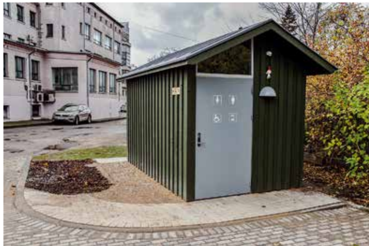
Pilsētas laukumā 3 izbūvēta jauna publiskā tualete, kas būs pieejama bez maksas. Tā ir pielāgota cilvēkiem ar kustību traucējumiem un aprīkota ar pārtinamo galdus mazulīšiem.

Tualete ikvienam būs pieejama bez maksas, taču nakts stundās tā būs slēgta, lai preventīvi novērstu izdemolēšanu un huligānismu.