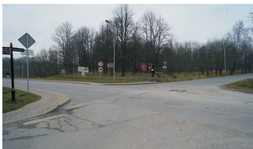
Skats no Stendes un Krasta ielas krustojuma.