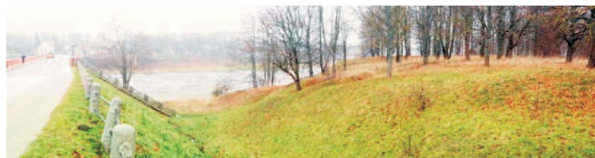
Skats uz Pārventas parku un uz Kuldīgas vecpilsētu.

Plānotās būvniecības ieceres vieta ir nominējamās UNESCO teritorijas «Kuldīgas vecpilsēta Ventas senleja» robežās .