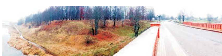
Skats no vecā Kuldīgas ķieģeļu tilta.