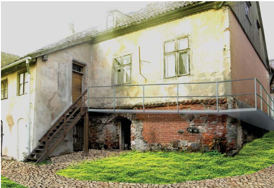
Balvu par vairāku alternatīvu izstrādāšanu idejai „Augstuma līmeņa pārvarēšanas iespējas” Baznīcas ielā 5 un 17 saņēma RTU studenti.