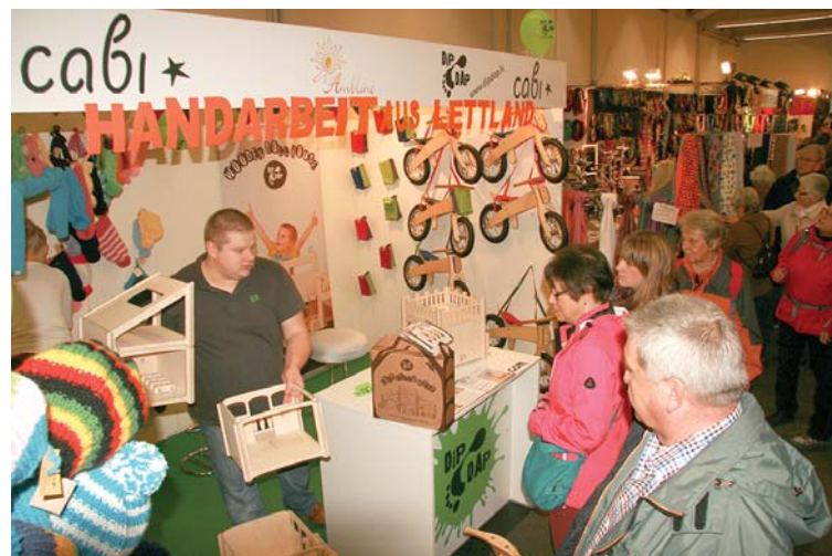
Ražotājs „MGS Factory” ar koka rotaļlietām – „Dip dap” skrejriteni un leļļu māju – veiksmīgi startēja vienā no lielākajām izstādēm Vācijā.

SIGNETA REIMANE, sabiedrisko attiecību speciāliste Publicitātes foto