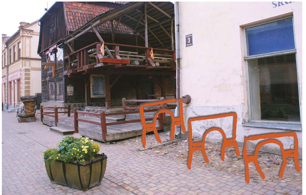
Otru balvu piešķīra LMA studentiem par ideju „Velosipēdu novietnes” Kuldīgā, Liepājas ielā un Pētera ielā 10 pie publiskajiem objektiem, kam par iedvesmu kalpoja vecais tilts.

Pasaules Arhitektūras dienu ietvaros no 9. līdz 11. oktobrim Kuldīgā notika arhitektūras studentu plenērs „Vides pieejamības risinājumi un universālais dizains Kuldīgas vēsturiskajā centrā”, kurā vislielāko atzinību guva RTU un LMA studenti.