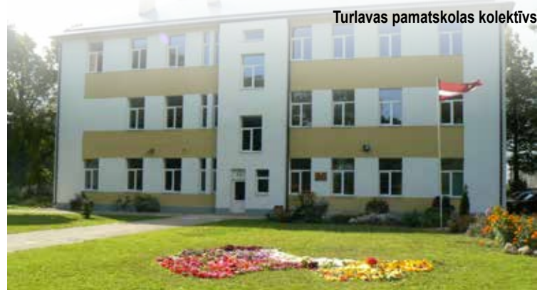
Turlavas pamatskolas kolektīvs

AICINĀM UZ ATVĒRTO DURVJU DIENU 26. aprīlī no 16.00 līdz 18.00.