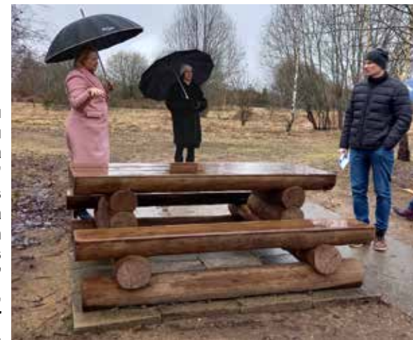
Iedzīvotāju iniciatīvu konkursa “Darīsim paši” žūrija tiekas ar projekta “Pastaigu un atpūtas parks “LABIRINTS” II” pieteicējiem, lai iepazītos ar projekta iecerēm.