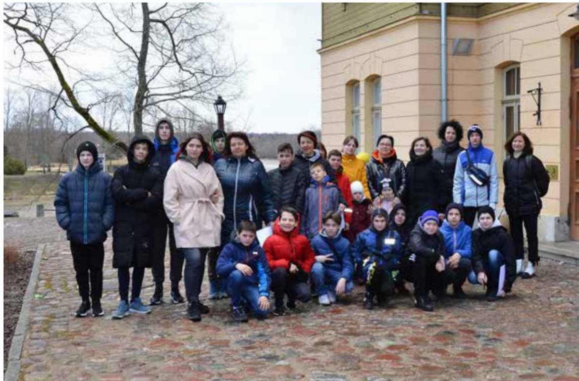
Ukraiņu bērni un arī pieaugušie, kas paglābušies no kara, priecājas iepazīt savas jaunās mājas – Kuldīgas novadu.