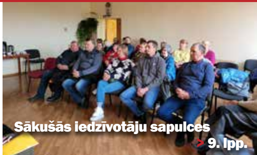
Sākušās iedzīvotāju sapulces > 9. lpp.