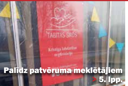
Palīdz patvēruma meklētājiem > 5. lpp.