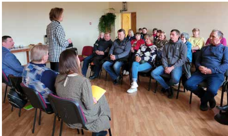
Gudenieku pagasta iedzīvotāju sapulcē atskatījās uz paveiktajiem darbiem pagājušajā gadā un ieskicēja šogad plānoto.