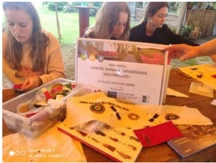
Eiropas Savienības un Kuldīgas novada pašvaldības finansētājās meistarklasēs jaunieši apguva jaunas zināšanas, senās amata prasmes un izgatavoja etnogrāfiski pareizu Ventas vainagu, lai popularizētu to sabiedrībā un saglabātu nākamajām paaudzēm.

ILONDAS REITAS, projekta vadītājas, teksts un foto