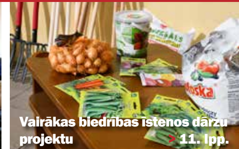
Vairākas biedrības īstenošas dārzu projektu > 11. lpp.