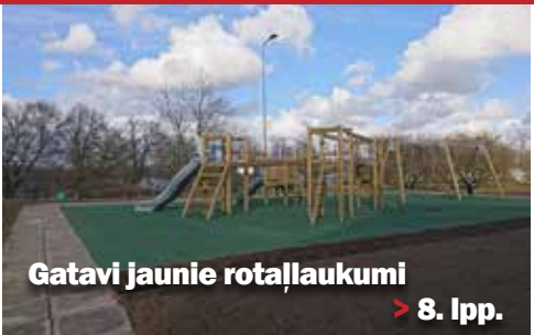
Gatavi jaunie rotallaukumi > 8. lpp.