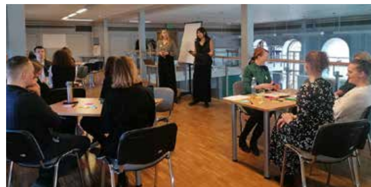
Jaunās starptautiskās maģistra programmas studenti praktiski demonstrēja studijās iegūtās zināšanas un prasmes, vadot semināru par tūrisma Kuldīgā.