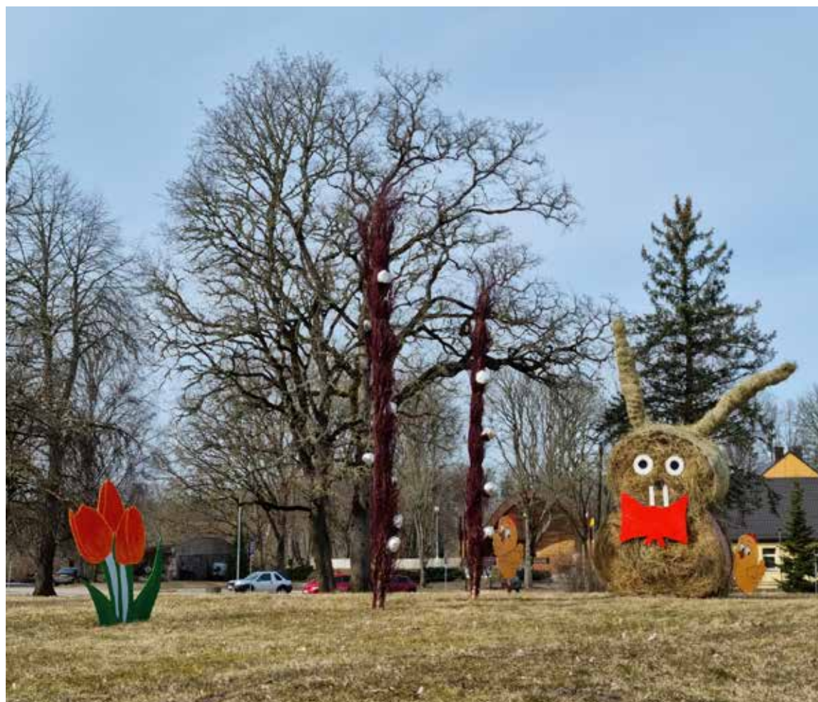
Rendas pagasta centru šajās Lieldienās apciemojis milzu zaķis. Sarūpēti arī citi rotājumi iedzīvotāju un viesu priekam.

18. aprīlī 11.00 pie "Bitītes" – leļļu teātra "Tims" izrāde bērniem "Lieldienu jampadracis".