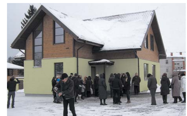
Rumbas pagasta Ventas ciema ļaudis kultūras dzīvi var baudīt jaunajā saieta namā „Bukaiši”.