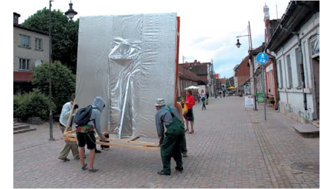
Šis gads aizvadīts hercoga Jēkaba zīmē – tiek lūkota vieta lielizmēra hercoga vides objektam „Teleport”.