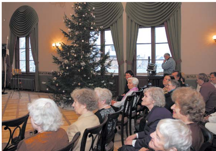
Represēto biedrības aktīvistu, no kuriem par spīti grūtībām staro optimisms un dzīvesprieks, ar patiesu sirsniņu un laipniību vēlēja viens otram veselību un visiem cilvēkiem laimīgu 2011. gadu.