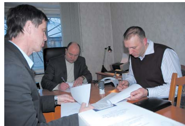
Ļoti svarīgs līguma parakstīšanas brīdis – tiek dots starts miljonu vērtajam pilsētas uždarsaimniecības sakārtošanas projektam.