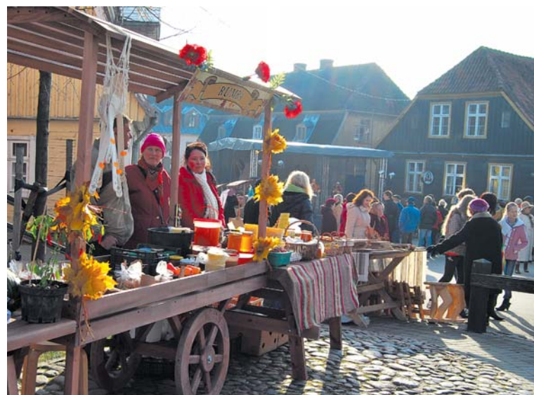
Hercoga Jēkaba 400. jubileju Kuldīgā svin godam, un varenais hercoga tirgus pulcē gan tirgotājus, gan pircējus.