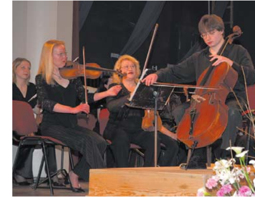
Kuldīgā izskan starptautiskais Kārļa Davidova čellistu konkurss.