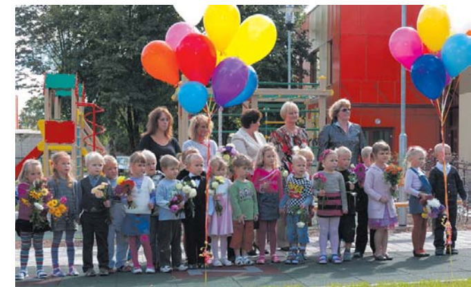
Prieks pašiem mazākajiem – „Cīruļi” bērni atgriezies atjaunotajā bērnudārzā.