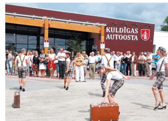
Sen gaidītā autoosta pilsētas centrā.