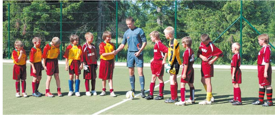
Futbolistiem pie Kuldīgas 2. vidusskolas tiek atklāts mākslīgā seguma futbola laukums.