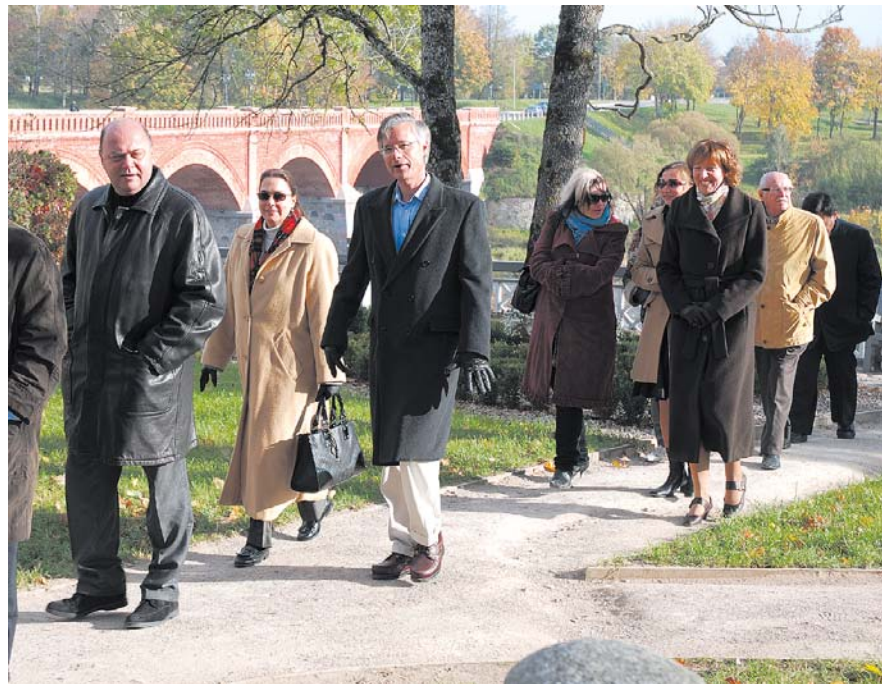
Latvijā rezidējošie vēstnieki Kuldīgas apmeklējuma laikā.