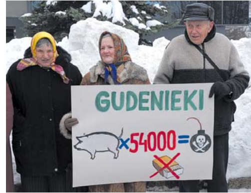
Iedzīvotāji saka dāņu cūku fermai Gudeniekos – nē.