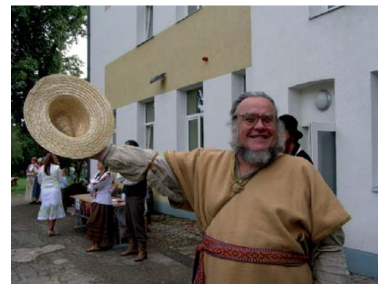
Turlavā ar vērienu svin Kuršu ķoniņu dienu.