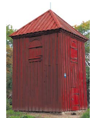
Atjaunots 1782. gadā būvētais Pēteru kapličas zvanu tornis – Valsts nozīmes arhitektūras piemineklis.