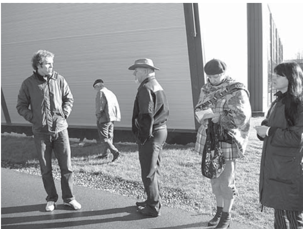
Koordinatoram Gatim Rožkalnam ir, ko stāstīt žūrijai.

Biedrība „Sela” iesniedza projektu „Sporta bāzes atjaunošana un labiekārtošana Kuldīgā, Mucenieku ielā 6”. Projekta vieta – Centra vidusskolas nefunkcionējošie sporta sektori stadionā. Mērķi: izveidot kvalitatīvu sporta bāzi, radot jaunus sporta laukumus uz vecās bāzes pamata, piedāvājot sporta aktivitātes dažāda vecuma cilvēkiem (īpaši jauniešiem), attīstot novadā līdz šim nebijušu sporta veidu – pludmales futbolu. Darba gaitā projekta grupa saskārās ar sarežģītumiem. Veicot vingrošanas rīku demontāžu, atklājās, ka to pamatnes iebetonētas un bez tehnikas tās nevar izcelt. Arī demontējot veco asfaltu, izrādījās, ka zem velēnas pa visu stadiona perimetru ieklātas betona apmales. Projekta autori cer, ka, piesaistot papildu finansējumu, jaunos pludmales un zāliena futbola laukumus oficiālās atklāšanas mačus varēs iekļaut nākamajos pilsētas svētkos.