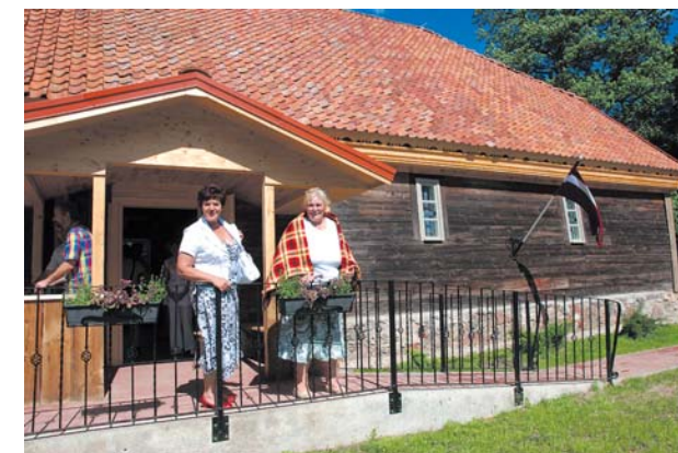
Baseniekiem jauns saieta nams.