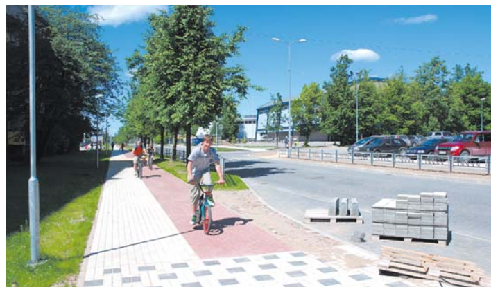
Piltenes un Liepājas iela skaisti atjaunota, gājējiem un riteņbraucējiem tagad katram savs celiņš.