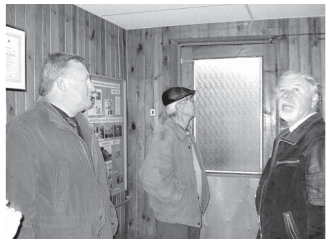
Komisijas vīri lietpratīgi vērtē remontu kvalitāti.

Grupa „Panāc pretī” strādāja Latvijas Sarkanā Krusta Kurzemes komitejas telpās Kuldīgā. Sākotnēji bija iecerētas citas aktivitātes, bet, mainoties personālījām, mainījās arī paredzētās aktivitātes. Visi plānotie darbi paveikti – sakārtota elektroinstalācija ēkas ārpusē, 1. stāva trīs telpās un koridorā, ielikti iekaramie griesti, izlīmētas tapetes divās telpās un nokrāsotas sienas vienā telpā. Nokrāsotas arī skaidu plākšņu grīdas, četri logi un 1. stāvā pārkrāsoti radiatoru.