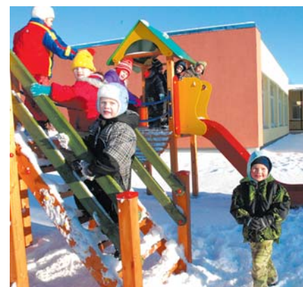
Kuldīgas novadā energoefektivitātes paaugstināšanas projekti noslēgušies 4 mācību iestādēs: PII „Taurenītis”, Kuldīgas 2. vidusskolā, PII „Ābelīte” Pelču filiālē, Turlavas pamatskolā (attēlā).