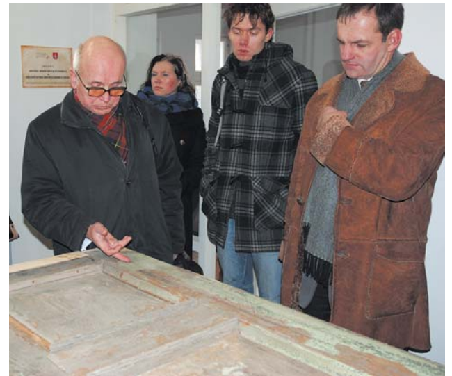
Kuldīgas restaurācijas centrā eksperti apskatīja, kā tiek atjaunotas senas koka durvis. Viņi uzteica iedzīvotājiem doto iespēju seno koka būvdetaļu atjaunošanā sadarboties ar restaurācijas centru.

„UNESCO statuss būtu kārtīgs apliecinājums tam, ka mēs esam uztvēruši pareizo stīgu un pēc tās arī vadāmies. Protams, tā ir atpazīstamība pasaulē. Daudzām vietām, kas ir iekļautas šajā sarakstā, tūristu apmeklējuma skaits ir palielinājies desmitiem reižu. Nokļūstot