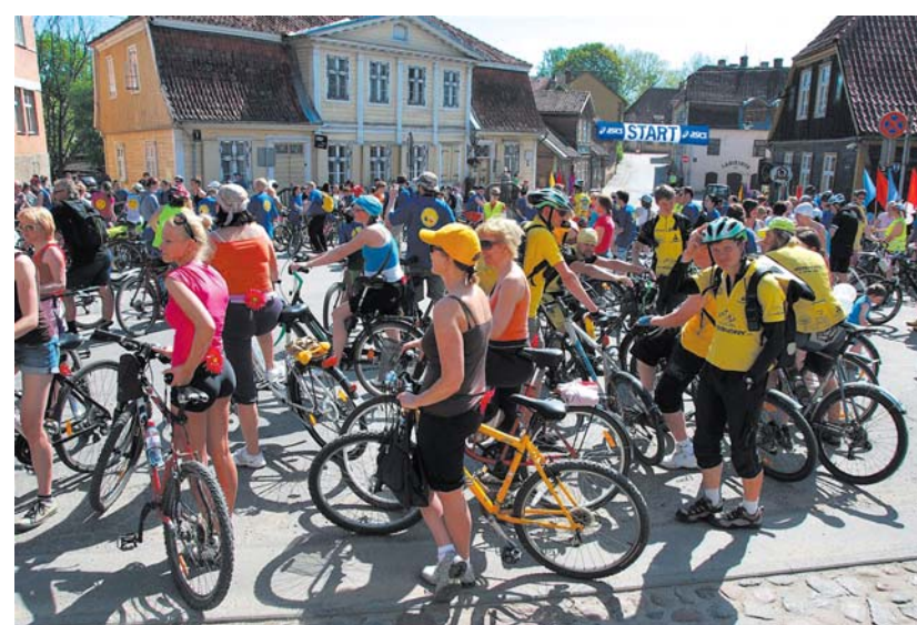
Velodiena apliecina, ka katru gadu aizvien vairāk kļūst zaļi domājoši.