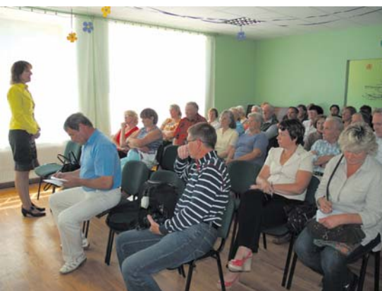
Novada Domes vadība tiekas ar iedzīvotājiem 13 Kuldīgas novada pagastos, arī Kabilē (attēlā).