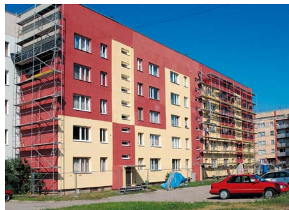
Pirmā māja Kuldīgā – Gaismas ielā 3, kas nosiltināta, izmantojot Eiropas fonda līdzfinansējumu.