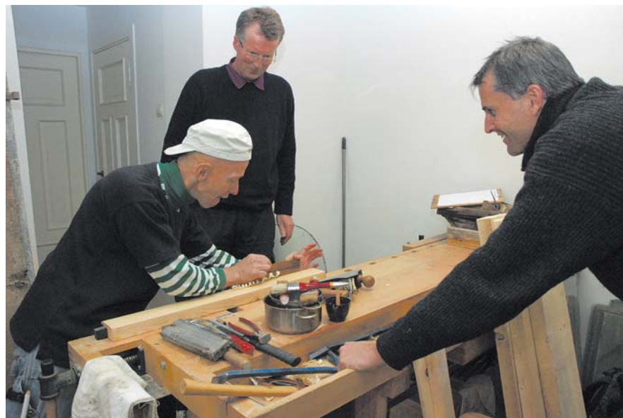
Darbu sāk Kuldīgas restaurācijas centrs.