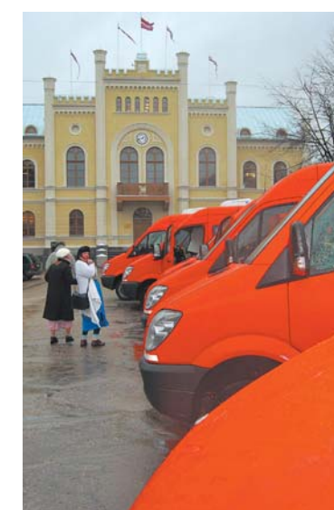
Pie šogad atjaunotās Rātsnama ēkas pīstājuši jauniegādātie autobusi skolēnu pārvadājumiem.