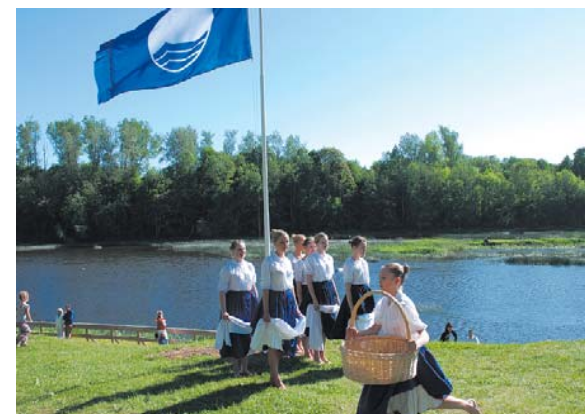
Kopš 2010. gada .... Mārtiņsalas peldvietā pie Ventas plīvo Zilais karogs, kas apliecina peldvietas tīrību.