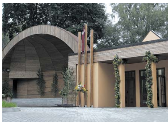
Rendā radīta jauka vieta kultūras baudīšanai.