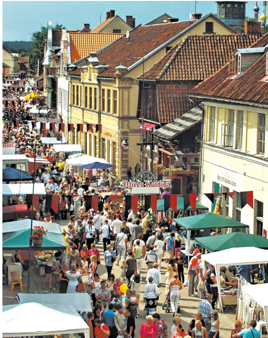
Kuldīgas Pilsētas svētki pārsteidz katru gadu no jauna.