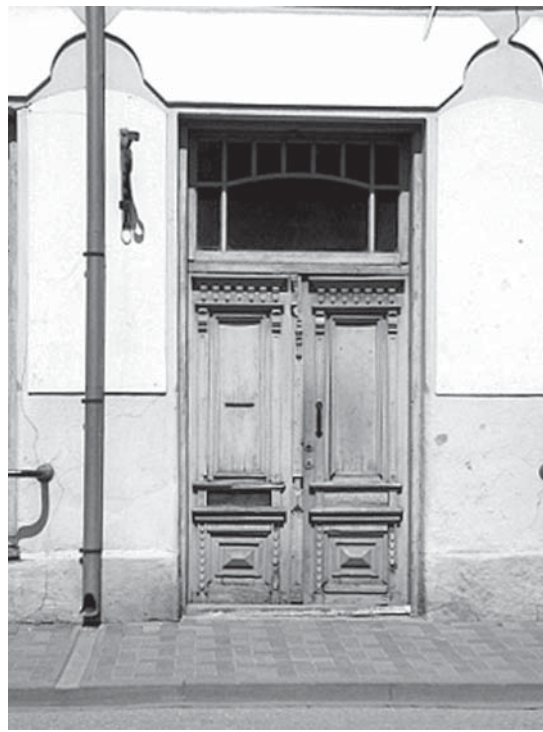
Unikālais durvju komplekts Liepājas ielā 25.

piebūve. Ēkas ielas fasādes durvju komplekts ir vietējās nozīmes mākslas piemineklis. Ārdurvis ar virslogu izgatavotas 19. gs.v. – 19. gs. 70. gadu sākumā, bet virsgaismas logs datējams ap 20. gs. otro pusi. Divvērtņu durvis izgatavotas rāmja