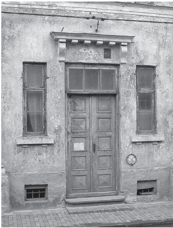
Baznīcas ielas 14. nama fasādes durvis ir vietējās nozīmes mākslas piemineklis.

Ēka Baznīcas ielā 14 celta 18. gs. otrajā pusē kā koka ēka. Pašreizējo veidolu tā ieguvusi 19. gs. vidū, nedaudz vēlāk uzcelta