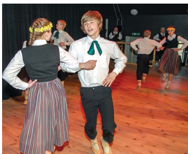
14. aprīlī Kabilē atklāj atjaunoto, ilgi gaidīto saietu namu.