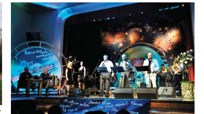
Gada sākumā Kuldīgas kultūras centrā notiek jaunā mūzikas albuma „Raimonda Paula ceremonijorkestris „Miers un Bērziņš” dzīro Kuldīgā” prezentācija.