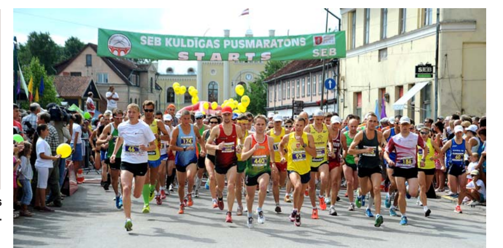
Augustā notiek jau 7. SEB Kuldīgas pusmaratons.