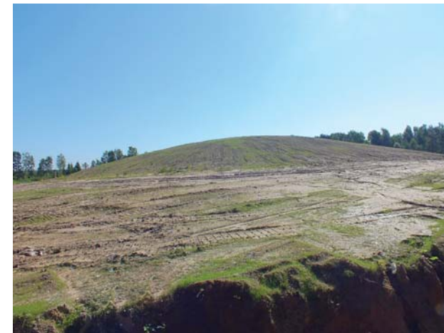
Rekultivēta izgāztuve „Zīles” Peļču pagastā.