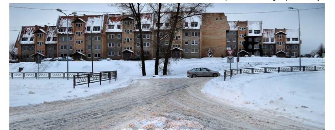
Rekonstruēts Lapeļu un Virkas ielas krustojums.