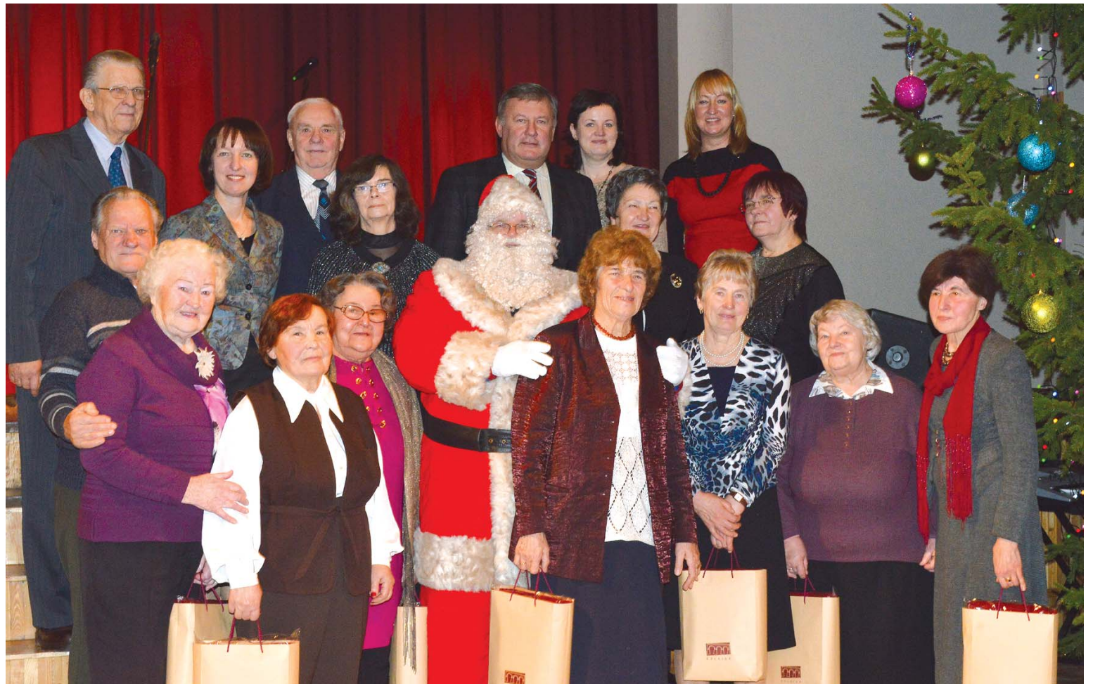
Gada nogalē pašvaldība atceras un godina pensionētos Domes darbiniekus.

Lai pateiktos par sadarbību un ieguldīto darbu, Kuldīgas novada Dome jau tradicionāli gada nogalē Ziemassvētku eglītes organizē represēto biedrības aktivistiem, Kuldīgas novada biedrību vadītājiem un Kuldīgas novada pensionētajiem Domes darbiniekiem.