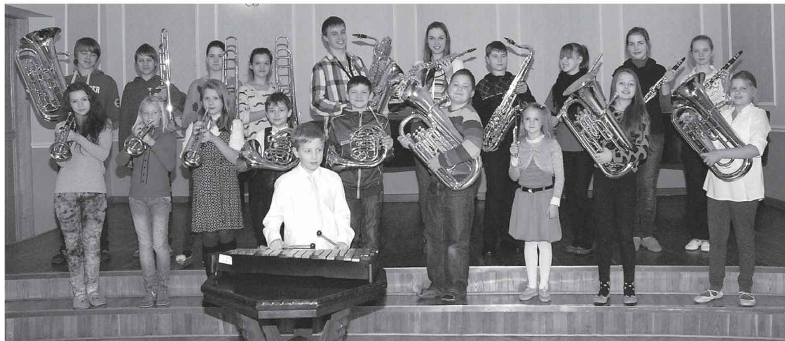
E.Vīgnera Kuldīgas mūzikas skolas audzēkņi ar jaunajiem instrumentiem.

Pirmā uzstāšanās ir paredzēta mācību gada beigās. Orķestra sastāvu papildinās skolas absolventi