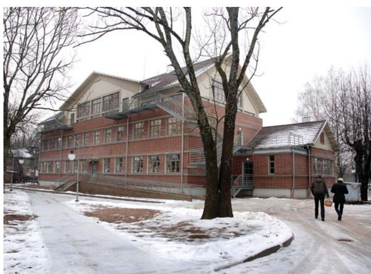
Janvārī pēc rekonstrukcijas svinīgi atklāj Kuldīgas Mākslas un humanitāro zinību vidusskolu.