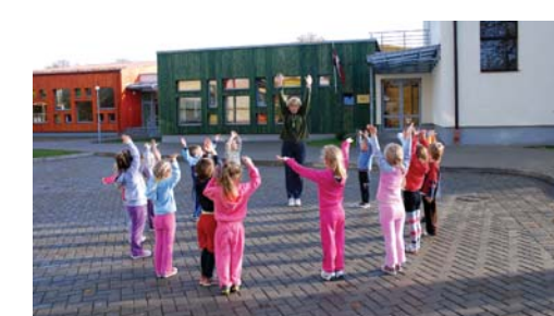
Bērnodārza „Ābelīte” celtniecības 2. kārtā pabeigta jaunā piebūve.