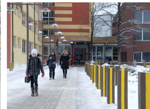
Kuldīgas Centra vidusskola pielāgota audzēkņiem ar īpašām vajadzībām.