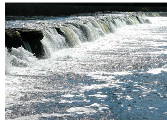
Ventas rumba tiek atzīta par Latvijas dižvietu.