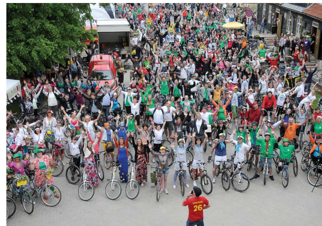
Piektajā Velodienā piedalās rekordliels dalībnieku skaits.