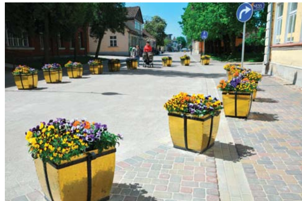
Noslēdzies novadā lielākais projekts – „Ūdenssaimniecības attīstība Kuldīgas pašvaldībā”. Projekts realizēts 64 ielās.