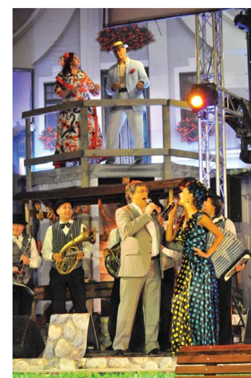
Ar vērienu norisinās pilsētas svētki „Dzīres Kuldīgā”.