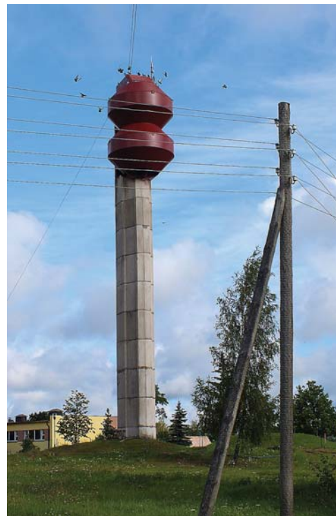
Sakārtota ūdenssaimniecība Gudeniekos un Kurmālē.