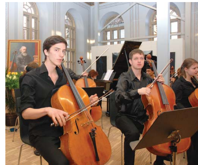
Maijā Kuldīgu pieskandina čellisti, koncertējot Kārļa Davidova VII starptautiskajā čellistu konkursā.