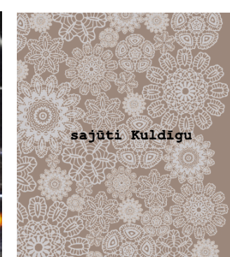
Klajā nāk mākslas fotoalbums „Sajūti Kuldīgu”.