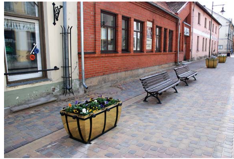
Projektā „Kuldīgas pilsētas ielu tīkla uzlabošana” par 3,2 miljoniem latu ir rekonstruēta Dzirnava, Mucenieku, Smiļu, Alunāna, Ventpils, Mālu, Torņa, Kaļķu, Annas, Parka un Grants iela, izbūvēta Rumbas ielas ietve, uzlabots ielu apgaismojums, labiekārtots Liepājas ielas vēsturiskais posms, kā arī rekonstruēts Sūru ielas posms starp krustojumiem ar Skrundas un Aizputes ielu.