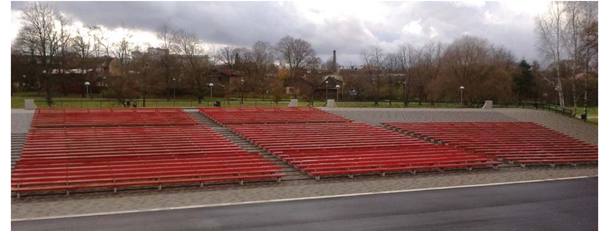
Rekonstruēta Kuldīgas pilsētas estrāde.