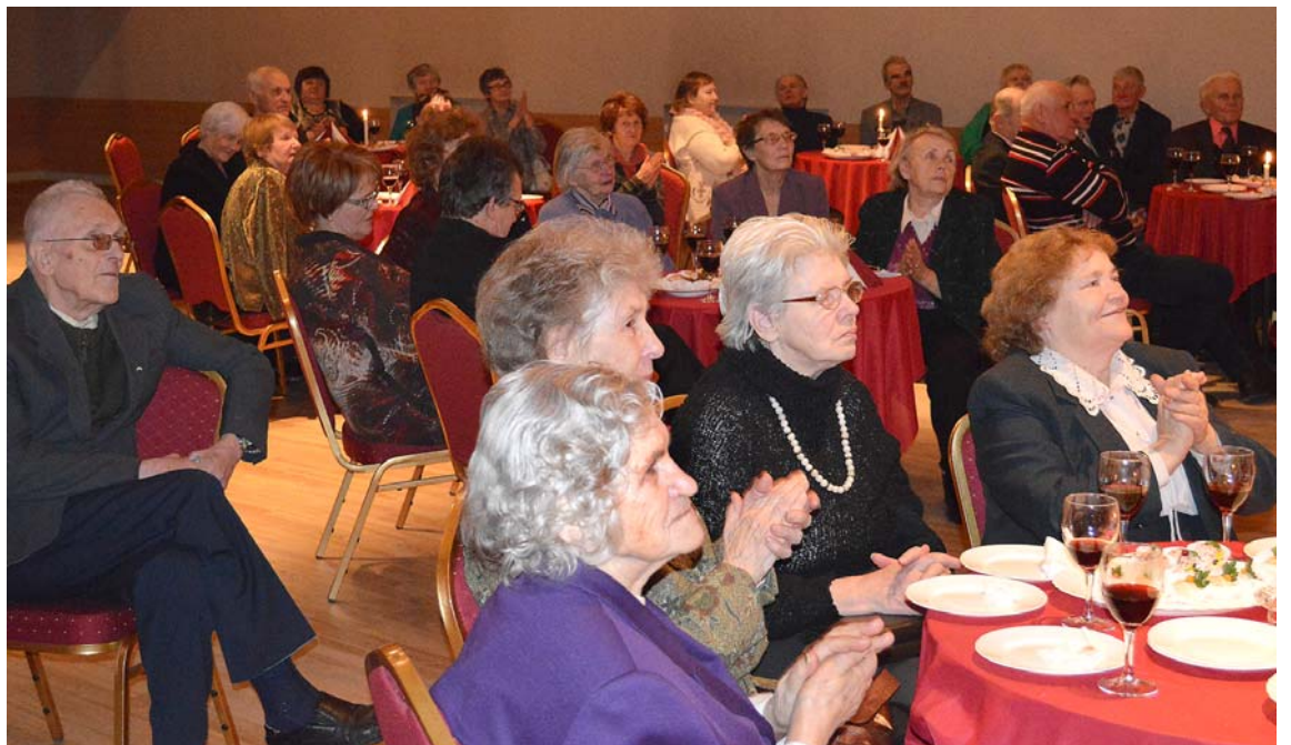
Ik gadu kuplā pulkā uz pašvaldības rīkoto Ziemassvētku pasākumu pulcējas represēto biedrības aktivisti.

ANITAS ZVINGULES teksts