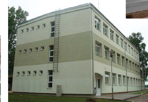
Septembrī darbu sāk jaunā skola Deksnē.