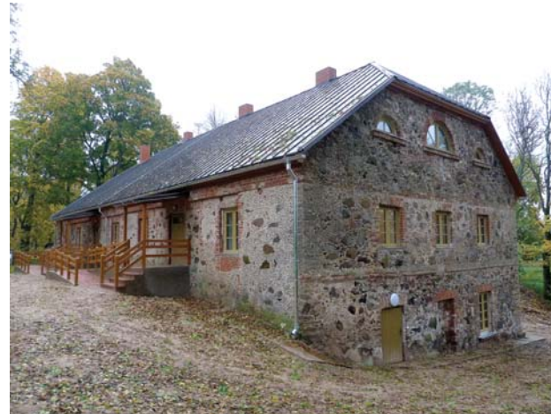
Kuldīgas novadā septiņās pašvaldības sociālajās dzīvojamajās mājās ar Eiropas Reģionālās attīstības fonda līdzfinansējumu pēc renovācijas uzlabota siltumnoturība. Nosiltinātas ir „Upītes” Gudeniekos, „Arkādijas” Snēpelē, „Gobas” Edolē, „Ūšas” Padūrē, „Mazivandes” Ivandē, „Dūru skola” Vārmē un Turlavas pagasta Kīkuru ciema ēka Ezera ielā 8. Kopējās izmaksas ir Ls 918 428,69.