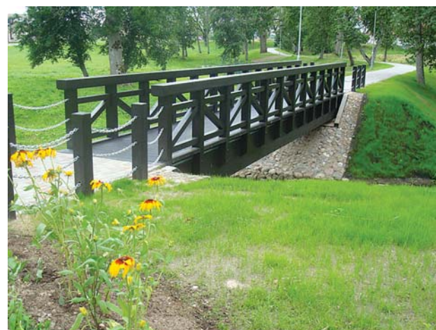
Padūrē izveidots gājēju ceļiņš un tilts.