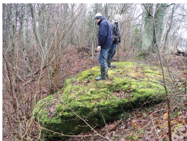
2012. gada ģeoloģiskais objekts – Rudziņu akmens Laidu pagastā.