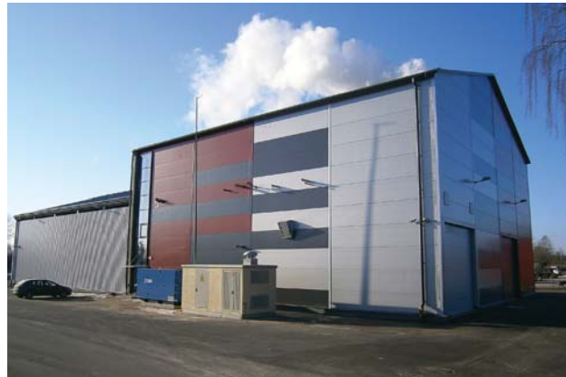
Kuldīgā, Stacijas ielā 6, pabeigta 3,6 miljonus vērtā biomasas koģenerācijas elektrostacija, un 23. martā notiek tās svinīgā atklāšana.