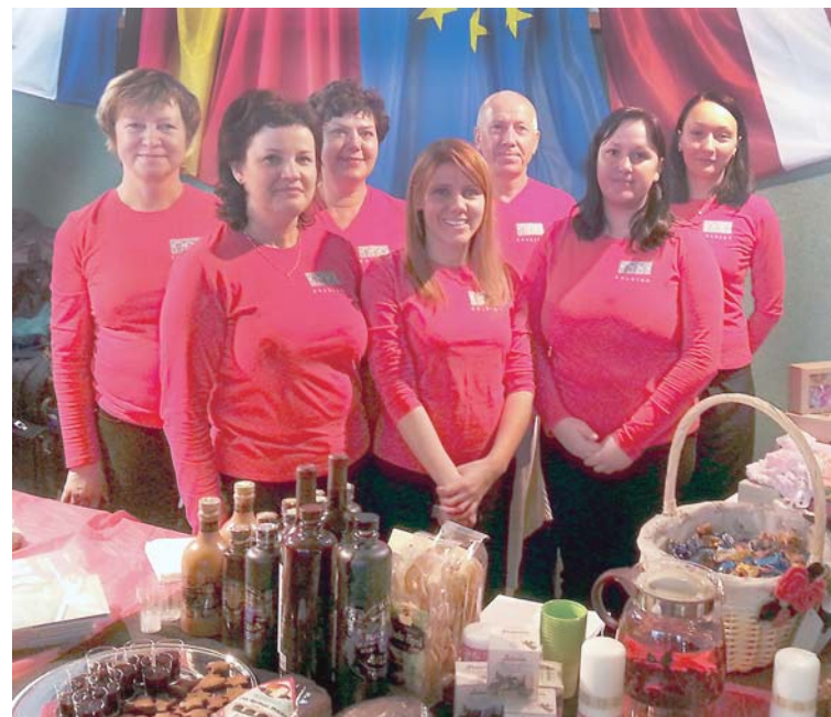
Kuldīgas novada pašvaldības delegācija Gēsthahtes Ziemassvētku labdarības tirdziņā piedāvāja ne vien mīļas un jaukas, bet arī garšīgas dāvanas.

1991. gada pavasarī Kuldīgā no Gēsthahtes pirmoreiz ieradās delegācija ar humānās palīdzības sūtījumu un birģermeistara vēstuli ar piedāvājumu turpmāk abām pilsētām sadarboties. 1996. gada pavasarī abu pilsētu vadība parakstīja līgumu. Sadraudzības pilsētā vairākkārt ar lieliem panākumiem koncertējis E. Vīgnera Kuldīgas mūzikas skolas koris „Cantus”, kamerkoris „Rāte”, jauniešu teātris „Focus”, veiksmīgi startējuši Kuldīgas sportisti. Ilgstošas un draudzīgas saites saista Kuldīgas Centra vidusskolu un Gēsthahtes reāl-