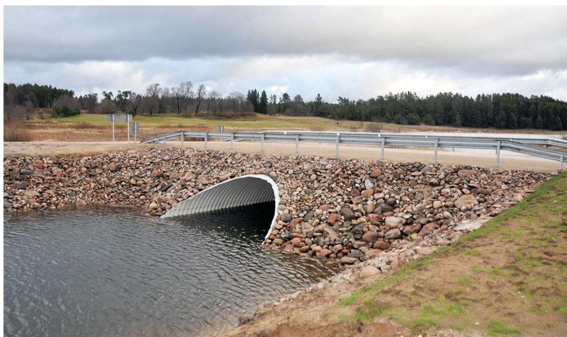
Caur jaunbūvēto caurteku Nabes ezerā brīvi varēs pārvietoties ar laivām. Tā nodrošinās arī nepieciešamo ūdens caurplūdi.

Kopējās būvdarbu izmaksas ir Ls 49423,01 no kuriem 5%