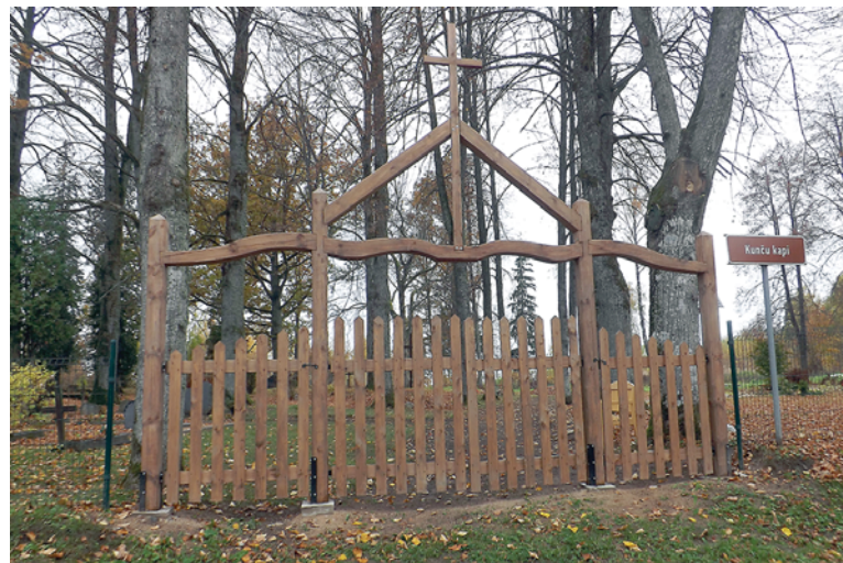
Basu ciema iedzīvotāji atjaunojuši Kunču kapsētas vārtus Gudenieku pagastā.

Ar iedzīvotāju atbalstu namam Kuldīgā, Mucnieku ielā 35, kāpņu telpā sienām noņemts vecais krāsojums, sienas, griesti un logi