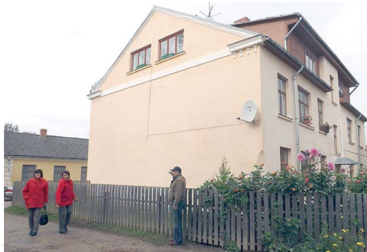
„Manas skaistās Mūsmājas” īstenotais projekts – nokrāsota Dzirnauvas ielas 4. nama sānu fasāde.

Biedrība „Padure” un grupa „Savējie” ir sakārtojuši rotaļu laukuma teritoriju: iesēts zāliens, izbūvēta smilšu kaste un žogs ap bērnu dārza teritoriju, iegādātas šūpoles, slīdkalniņš un spēļu māja. Izveidota sajušu taka, atpūtas stūrītis, vilcieniņš, dambrete un klasītes, iekārtota rūķīšu mājiņa. Projektā palīdzēja z/s „Upeskalni” un SIA „Laimdotas”.