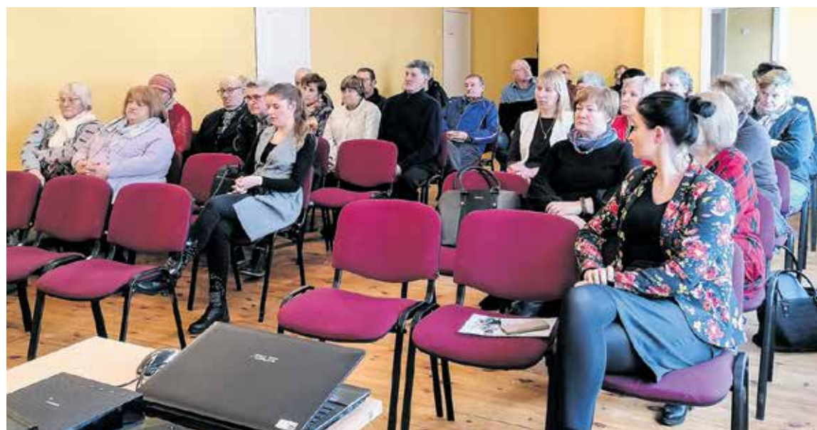
Laidenieki iedzīvotāju sapulcē sprieda par dažādām tēmām. Izskanēja ierosinājumi Sermītē atjaunot peldvietu un uzstādīt papildu apgaismes stabus, lai izgaismotu ceļu no "Kameņu" mājas līdz veikalam.