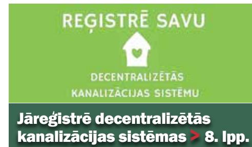
Jāreģistrē decentralizētās kanalizācijas sistēmas > 8. lpp.