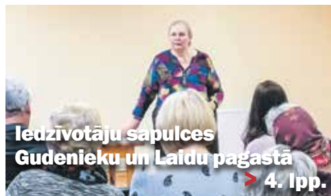
Iedzīvotāju sapulces Gudenieku un Laidu pagastā > 4. lpp.