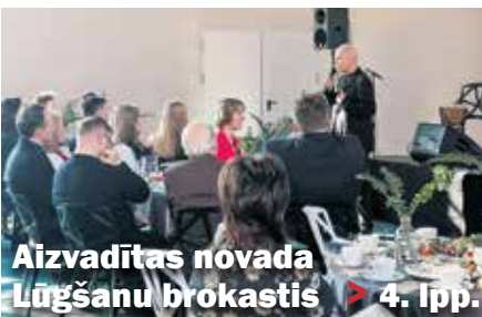
Aizvadītas novada Lūgšanu brokastis > 4. lpp.