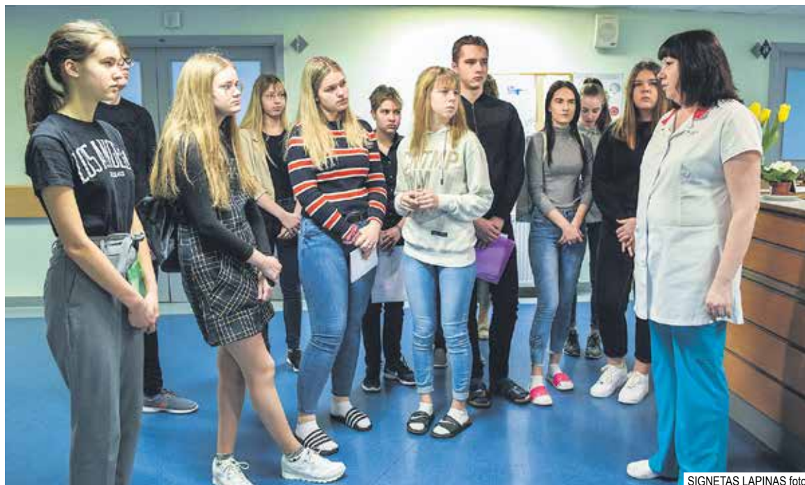
SIGNETAS LAPIŅAS foto