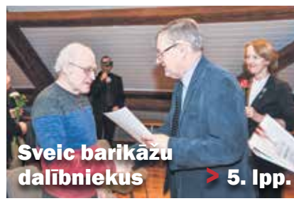
Sveic barikāžu dalībniekus > 5. lpp.