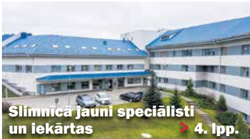
Slimnīcā jauni speciālisti un iekārtas > 4. lpp.