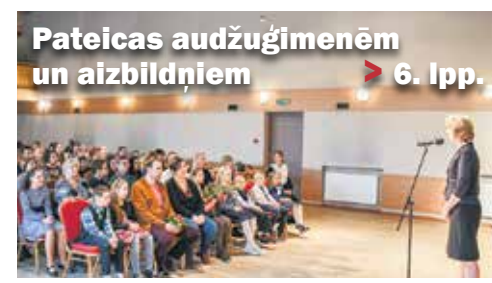
Pateicas audzūģimēnēm un aizbildņiem > 6. lpp.