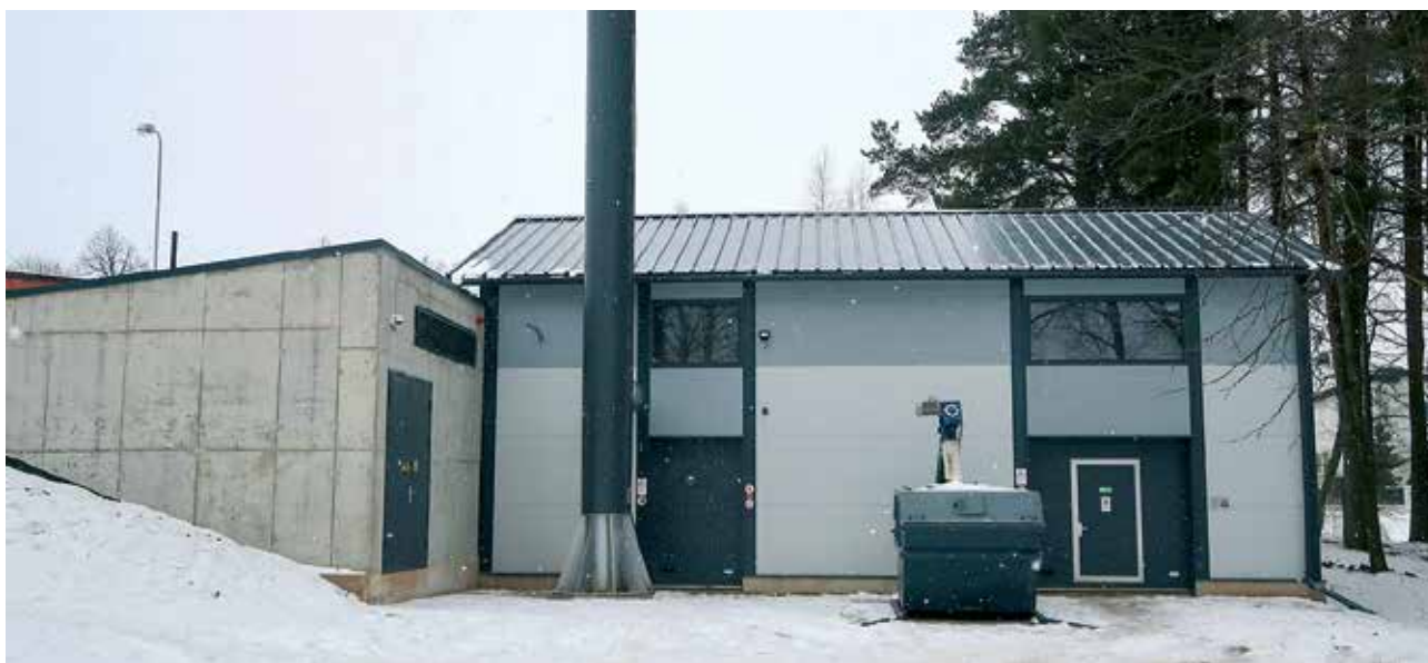
Priedaines ciema iedzīvotājiem tapusi jauna katlumāja, kas darbojas automatizēti.

16. februārī, piedaloties pašvaldības, būvnieku un projektētāju pārstāvjiem un citiem viesiem, svinīgi tika atklāta Priedaines jaunā katlumāja.