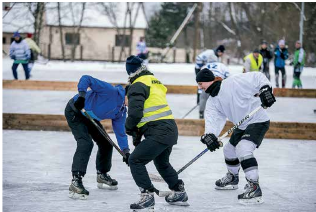
Klasiskajā hokejā sacentās sešas komandas, gūstot ne mazums vārtu. Attēlā – cīņa starp Kurmāles un Turlavas komandu.

Tā kā ziema šogad iepriecināja ar sniegu un salu, sportisti aktīvi piedalījās tādās klasiskajās ziemas sporta veidos kā zemledus makšķerēšana, hokejs, slēpošana. Bija arī dažādas disciplīnas telpās: zoles turnīrs, novuss, galda teniss, šautriņu mešana, šaušana ar pneimatisko šauteni, šahs, dambrete, svaru