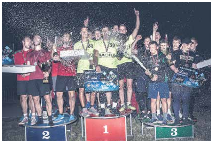
Ceturtais “Nakts četrčīnās” sacensībās, kurās piedalījās 15 komandas, uzvaru izcīnīja Kables sportisti.

Finālā volejbola laukumā sacentās Kables un “Watermelons”