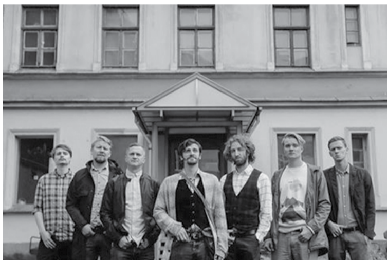
Karaliskais improvizācijas teātris skatītājus pārsteigs arī Kuldīgā.

šiem vecumā no 15 līdz 18 gadiem, kā arī tiem, kas šajā vecumā grupā neiekļaujas. Komanda ir radījusi unikālu mācību metodi, kas ļauj jebkuram cilvēkam stundas laikā mainīt savu dzīvi. "Veiksmes akadēmija" ir vienīgā mācību iestāde, kuru var pabeigt tik īsā laikā un kura sola, ka 99% tās absolventu dzīve mainīsies. Apmācība ir vienkārša, to vada divi jauni aktieri, kuri agrāk savā profesijā jutās vīlušies. Viņi nespēja sasniegt tos panākumus, par kuriem sapņoja. Un viņi sāka zaudēt ticību tam, ka dzīvē vispār ir veiksmes. Viņi apkopoja gandrīz visas zināšanas, metodes un mācības un izveidoja veiksmes formulu, kas ir "Veiksmes akadēmijas" apmācības pamatā.