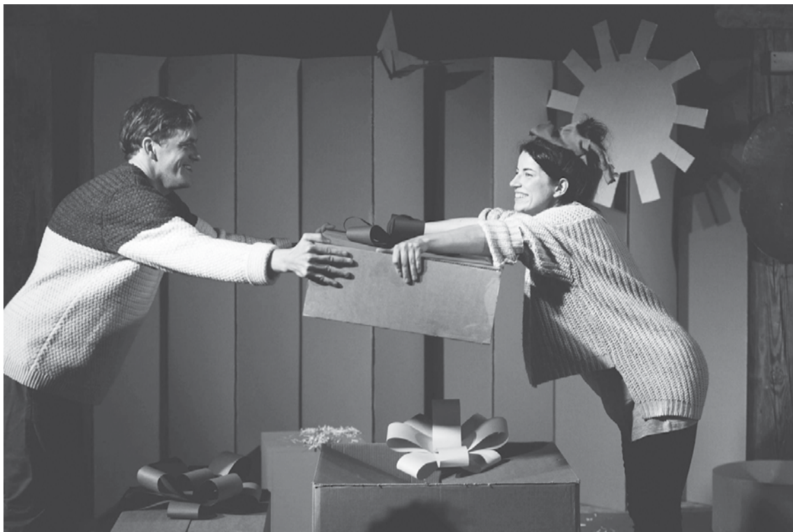
Bērnu izrāde "Kaka un pavasaris" uzjautrinās, sasmidzinās un izglītos mazos teātra mīļotājus.

8. oktobrī 16.00 Kuldīgas novada Bērnu un jauniešu centrā notiks "Dirty Deal Teatro" izrāde "Veiksmes akadēmija", kas savu pirmizrādi vēl tikai piedzīvos, un ir domāta jaunie-