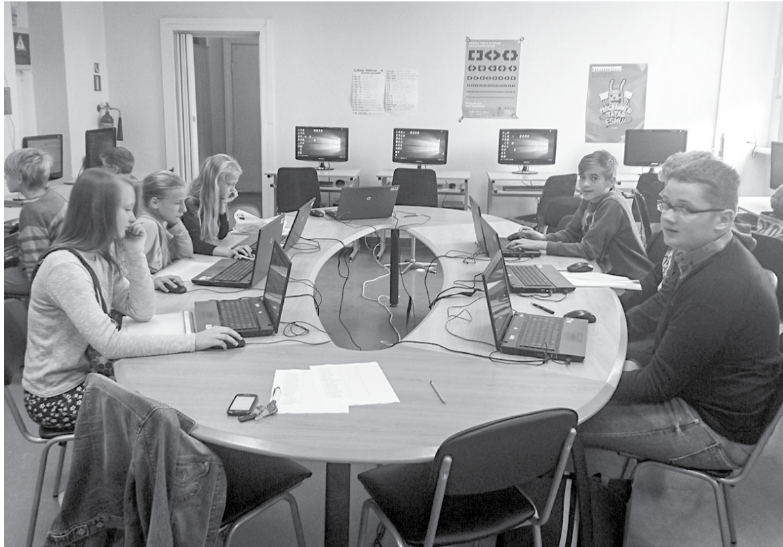
Jauno talantu skolas dalībnieki piedalās nodarbībā “Timekļa lapu sagatavju izmantošana mājaslapas izveidē”.

KRISTĪNE DUĻBINSKA, Mārketinga un sabiedrisko attiecību nodaļas vadītāja