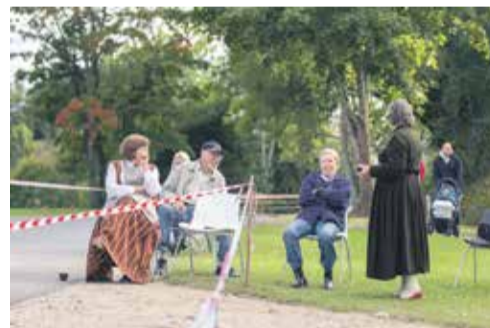
Pie Padures klēts izveidotajā skatupunktā fani baudīja jautru kompāniju, mūziku un siltu tēju.

Preses konferencē tika pasniegta arī prestižā “Colin McRae Flat Out Trophy” balva par īpašu cīņassparu un rallija sportiskā gara uzturēšanu. Pirmo reizi kopš šī apbalvojuma izveidošanas to saņēma uzreiz divi sportisti – liepājnieks, 17 gadus vecais Mārtiņš Sesks un piecpadsmitgadīgais somu autosportists Kalle Rovāpera, kuri rallijā demons-