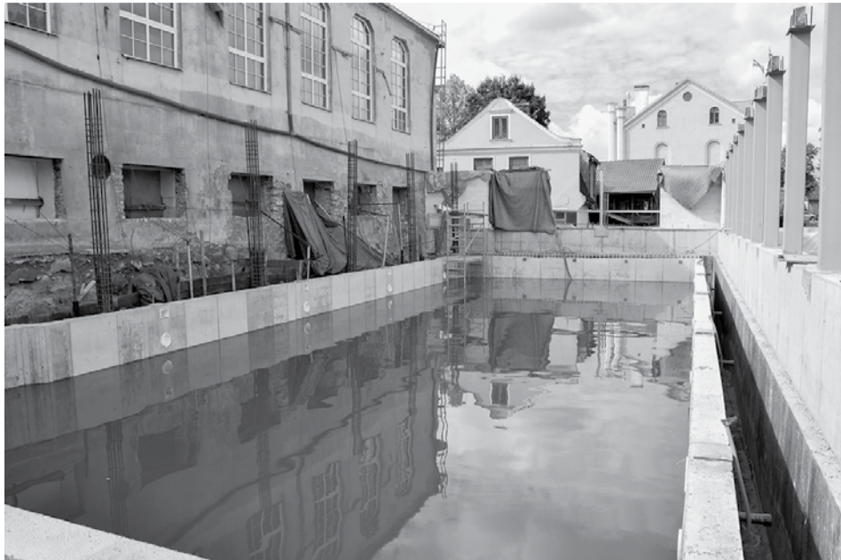
Topošajā peldbaseinā ielaiž ūdeni, lai pārbaudītu, vai neveidojas sūces un baseins ir noturīgs.