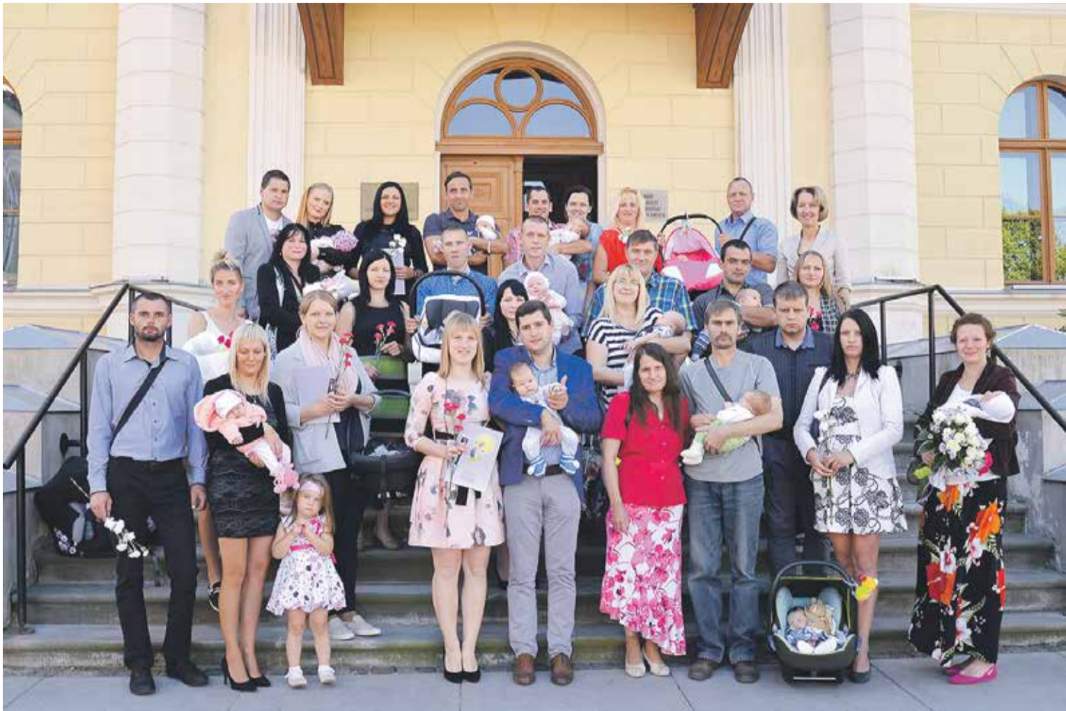
Vasarā dzimušie mazuļi pēc sudraba karotīšu svinīgās saņemšanas kopīgi fotografējās pie Kuldīgas novada Domes.

Visi Kuldīgas novada jaundzimušie uz svinīgo pasākumu tiek aicināti reizi divos mēnešos, nākamā tikšanās būs 2016. gada 8. novembrī.