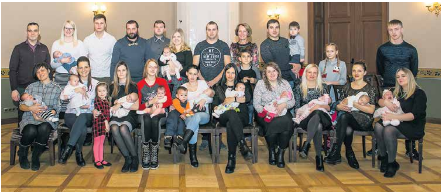
Janvārī sudraba karotītes par piemiņu no dzimtās vietas saņēma novembrī un decembrī reģistrētie mazulīši.

Kuldīgas novada Dzimtsarakstu nodaļas vadītāja