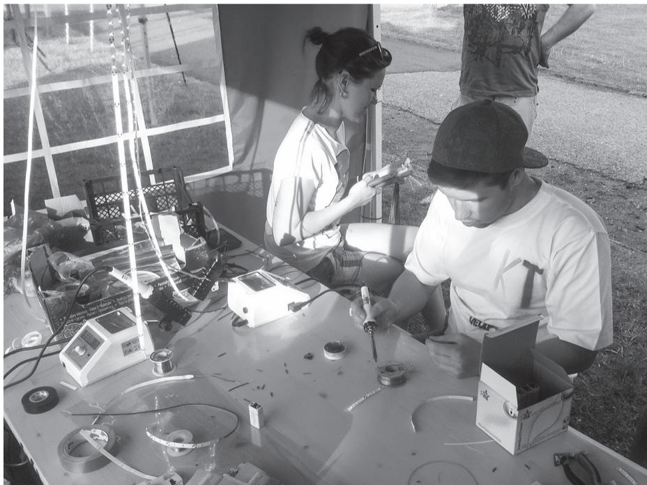
Velofestivāla pieturā „Esi spožs un drošs” ikviens varēs izgaismot savu velosipēdu ar gaismiņām, lai nakts braucienā būtu pamanāms.

Kuldīgas velofestivālā, kas notiks sestdien, 28. maijā, darbosies neparastas radošās pieturas – darbnīcas, bet muzikālu baudījumu dos vairāku grupu un solistu sniegumi.