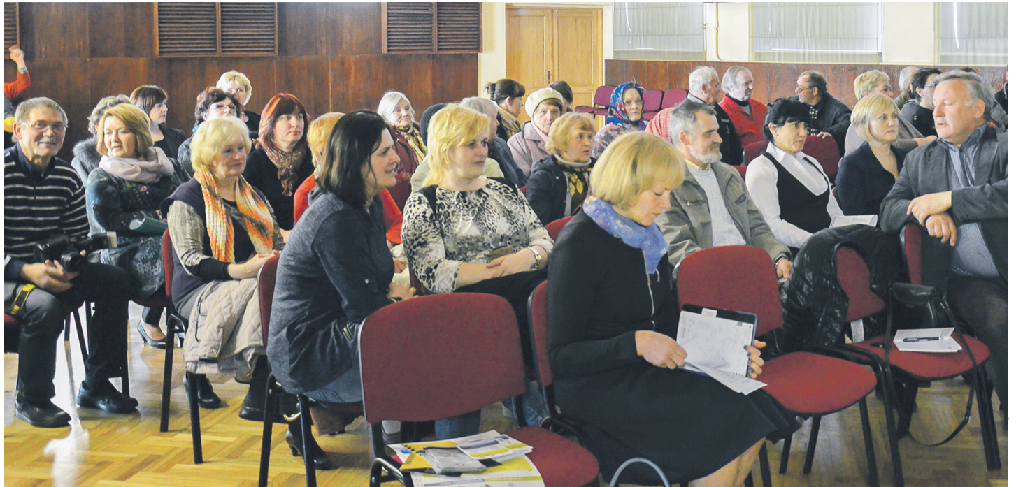
Ēdoles pagasta sapulces dalībnieki aktīvi iesaistījās diskusijās par sabiedrisko kārtību.