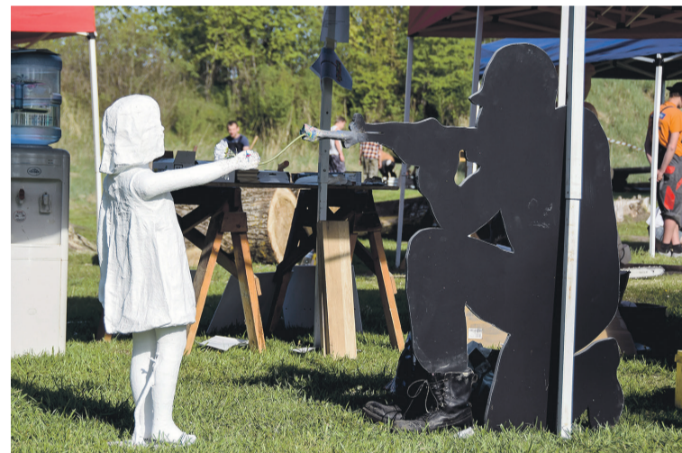
Lingenas profesionālā tehnikuma audzēkņi koktēlniecības plenērā radīja skulptūru „Mieram”.

SIGNETA LAPIŅA, sabiedrisko attiecību speciāliste