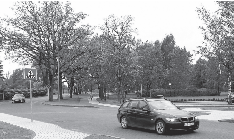
Sūru ielā netālu no PII „Ābelīte” izveidota jauna gājēju pāreja.