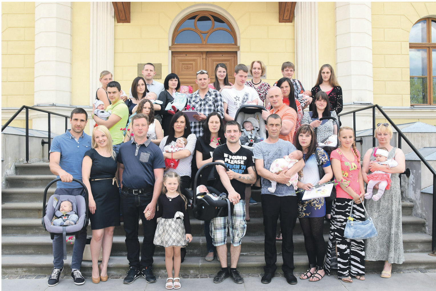
Vecāki un jaundzimušie, kuri 10. maijā bija ieradušies uz svinīgo sudraba karotīšu saņemšanu Kuldīgas novada Domē.

ILONA ĶESTERE, Dzimtsarakstu nodaļas vadītāja