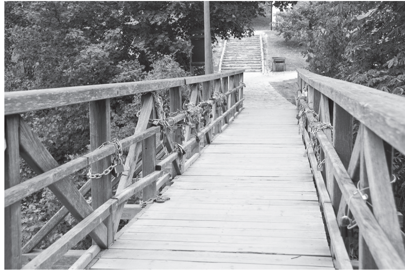
Rekonstruēs tiltiņu, kas ved uz Mārtiņsalas peldvietu. Jaunlaulāto atslēgas pēc pārbūves novietos atpakaļ.

Kuldīgas peldvieta „Mārtiņsala” jau septīto gadu saņem Zilo karogu kā apliecinājumu par izcilu ūdens kvalitāti un sakārtotību.