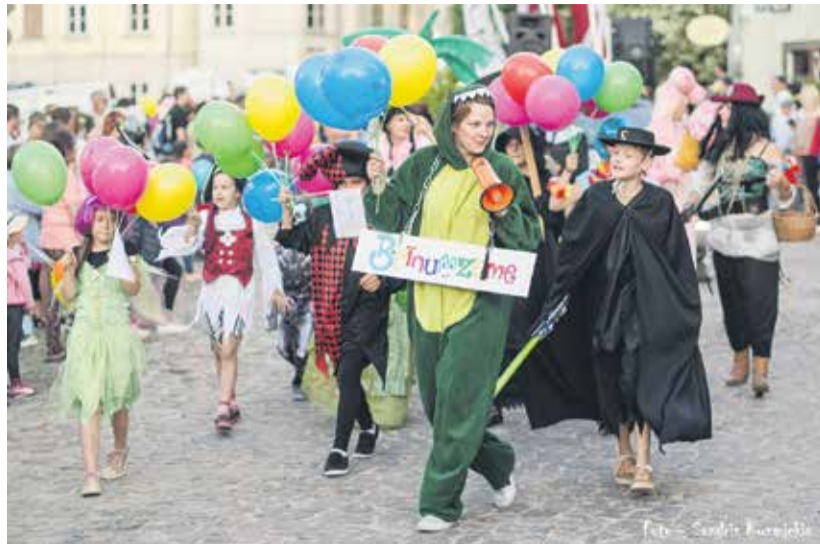
Dzīru gājiens ir neatņemama pilsētas svētku sastāvdaļa – tad iedzīvotāji, uzņēmumi, kolektīvi, biedrības un daudzi citi dodas kopīgā gājienā, lai sajustu, kā pilsēta uzgavilē, gūtu pozitīvas emocijas un stiprinātu kopības sajūtu, apliecinot piederību savai pilsētai. Īpaši izveidotā žūrija labākos apbalvo vairākās nominācijās. Šogad nominācijā "Jaunie kuldīdznieki" tika apbalvots bērnu izklaides centrs "Brīnumzeme".