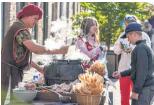
Dzīru tirgus šogad darbojās četras dienas un piedāvāja labākos mājražotāju un amatnieku darinājumus. Tirgū piedalījās gandrīz 300 tirgotāju.