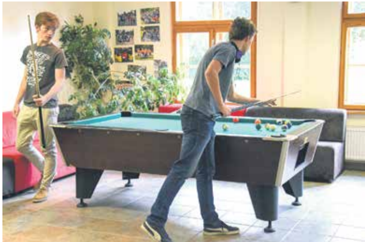
Kuldīgas, Skrundas un Alsungas jaunieši mājā var saturīgi pavadīt brīvo laiku, piemēram, spēlējot biljardu.

Jauniešu māja iekārtota telpās, kur līdz šim darbojās Kuldīgas Sv. Katrīnas draudzes Diakonijas centrs, bet, sabiedrībai attīstoties, telpas draudzei vairs nav bijušas