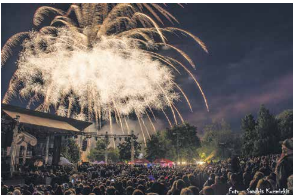
Ar krāšņu salūtu pilsētas estrādē atklāja festivālu "Dzīres Kuldīgā".