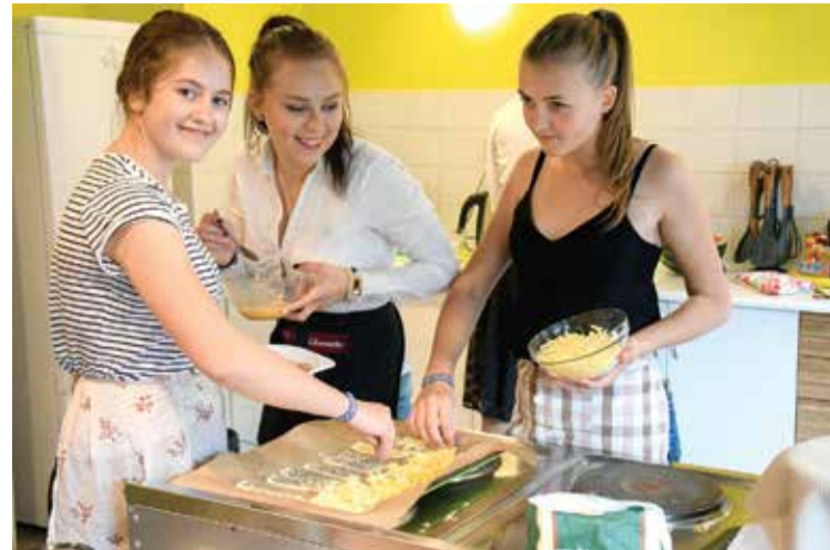
Jauniešu mājā aprīkota virtuve, kurā ikviens dalībnieks var cept, vārīt un gatavot.

14. un 15. jūlijā ikviens interesents bija laipni gaidīts uz atvērto durvju dienām, lai iepazītu Kuldīgas