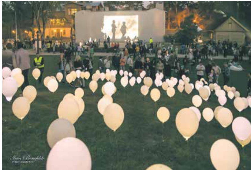
Pilsētas dārzā valdīja maģiska noskaņa. Pasākumā "Zvaigžņu gaismā" klātesošie sajuta, kā izskatās skaņa, garšo gaisma un skan krāsa.