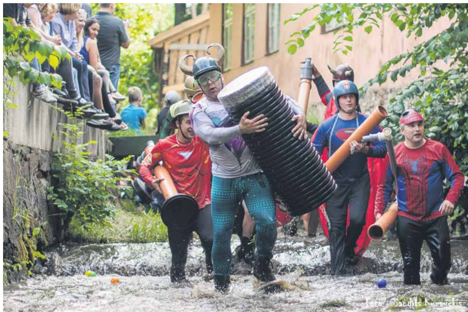
Tradicionālajā Alekšupītes karnevālā piedalījās astoņas komandas no Kuldīgas, Padures, Rīgas, Ogres, Limbažiem un pat Daugavpils. Par atraktīvāko žūrija atzina Valsts ugunsdzēsības un glābšanas dienesta Kuldīgas nodaļas komandu "Aptaurētie taurētāji".

Kā allaž jūlija trešajā nedēļas nogalē Kuldīgā norisinājās Dzīres – šogad jau divdesmit otro reizi.