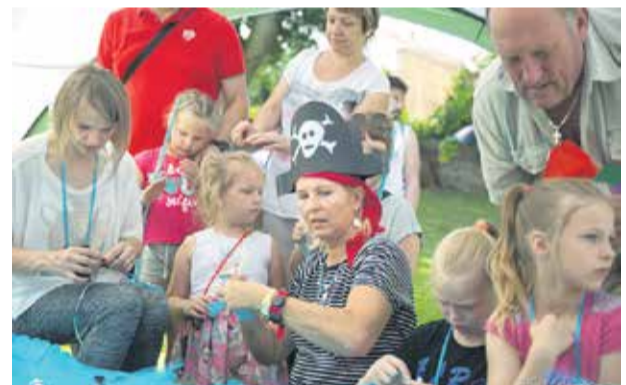
Pirāti un nāriņas aicināja mazos Dzīru dalībniekus piedalīties aizraujošā piedzīvojumā – darbnīcās bērniem bija jāveic dažādi uzdevumi un jākrāj monētas.