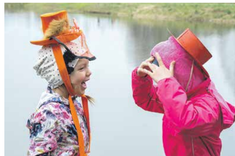
„MILZU!” fotopieturā bija dažādi rekvizīti, lai dalībnieki varētu uzpucēties un pozēt kamerai.