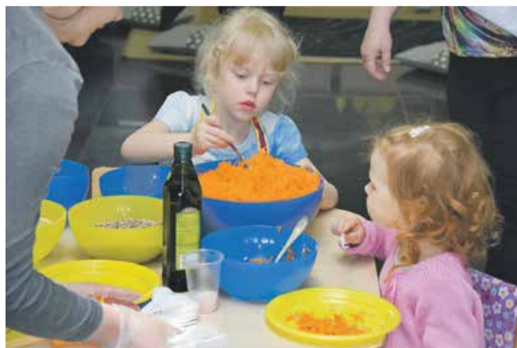
Bērni ar prieku gatavoja veselīgus salātus un uzkodas.