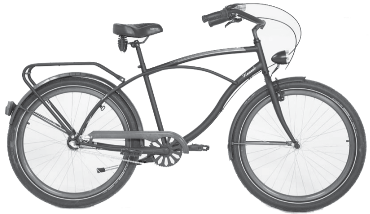
Velodienā varēs laimēt stilīgu velosipēdu.

Velofestivālā veiksmīgākajam dienas brauciena dalībniekam izlozes kārtībā būs iespēja iegūt stilīgu „Kenzel Cruiser” velosipēdu, kuru dāvā uzņēmums „VeloAtlaides.lv”.