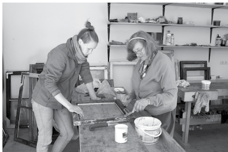
Vecpilsētas iedzīvotāji jau sesto gadu iesaistās māju logu sakārtošanā.

Pirmdien, 30. maijā, 17.00 restaurācijas centrā tiem, kuri iepriekš būs pieteikušies, tiks rīkots praktisks pasākums „Logu regulārā apkope”, kurā varēs noslēgt sadarbības līgumu. Centra restauratori skaidros un praktiski rādīs iedzīvotājiem, kā un cik bieži jāveic logu rāmju apkope. Restaurators J.Mertens stāstīs par krāsu toņu izvēli, krāsām, kādas būtu jālieto, lai logi ilgāk kalpotu. Iedzīvotāji paši varēs apgūt logu iekītošanu, jo vēsturiski Kuldīgā stikli nav bijuši stiprināti ar līstēm, šis vecpilsētai neatbilstošais paradums ieviests padomju laikos. Praktisko darbu veikšanā palīdzēs