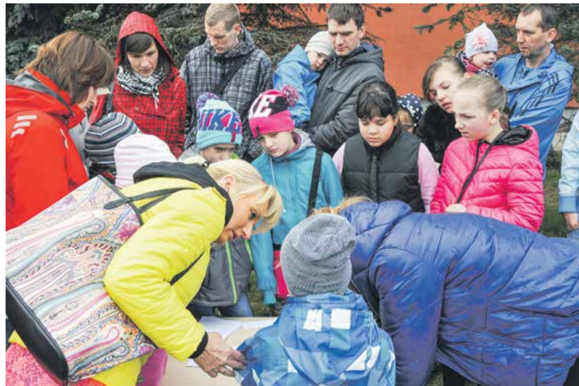
Ģimenes devās „MILZU!” dārgumu meklēšanas pārgājienā, pildot dažādus uzdevumus.