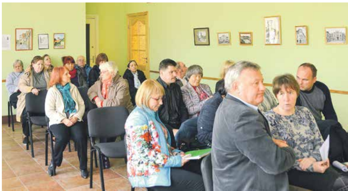
Rumbas pagasta iedzīvotāji ikgadējā sapulcē uzdeva aktuālos jautājumus par māju apsaimniekošanu un pagasta sakārtošanu.