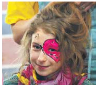
Mazie dalībnieki gaidīja rindā, lai tiktu pie sejas apgleznojuma.

JANA BERGMANE, Kuldīgas aktīvās atpūtas centra vadītāja vietniece ARTA GUSTOVSKA un INESES KRONES foto