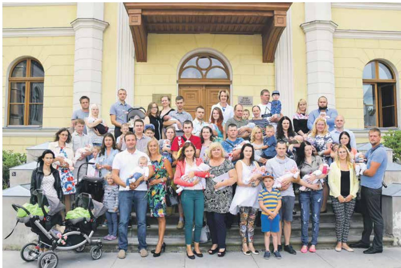
Pie rātsnama uz kopīgu foto pulcējās maijā un jūnijā dzimušie mazuļi ar ģimenēm un draugiem.

nav apmeklējuši pasākumu un saņēmuši mazo piemiņas dāvaniņu, to izņemt gada laikā Kuldīgas