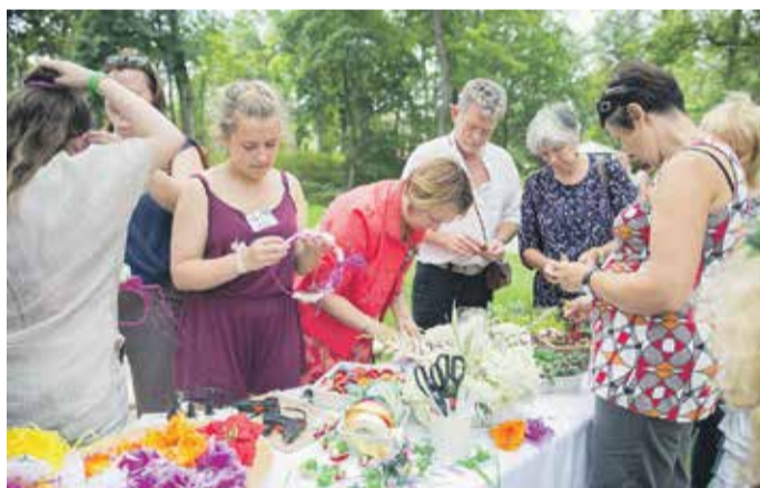
Dāmas un kungi Dārza svētkos gatavoja sev matu rotas un dažādas piespraudes no ziediem un citiem materiāliem.