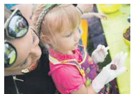
Alises fantāziju pasaulē bērni varēja ne tikai ielūkoties greizajos spoguļos un satikt trušus, bet arī pagatavot sev kūciņu uz kociņa.