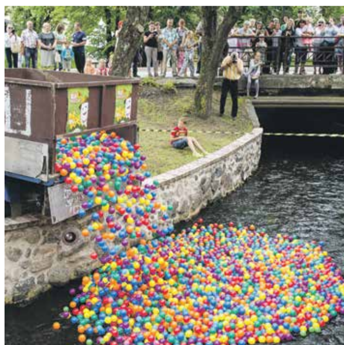
Superatrakcijā “Zelta ikrs” tradicionāli piedalās vairāki tūkstoši dalībnieku, tādējādi atbalstot “Dzīru” norisi. Šogad galvenajā balvā bija ceļojums uz Ungāriju, kā arī 99 citas jaukas dāvanas no svētku atbalstītājiem.