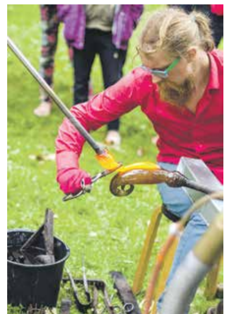
Piltenes ielā bija iespēja apskatīt starptautisku stikla mākslas simpoziju “Eco Glass” izstādi “Gaismas objekti”, kurā piedalījās mākslinieki no Lietuvas, Baltkrievijas, Krievijas, Zviedrijas un Islandes.