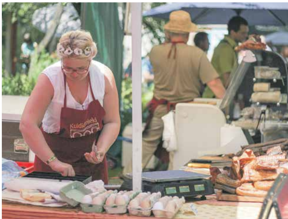
Kalnciema ielas tirgū apmeklētāji varēja iegādāties dažādus Kuldīgas pusē labumus.

Kuldīgas dienas apmeklētāji tika iepazīstināti arī ar gaidāmajiem Kuldīgas pilsētas svētkiem „Dzīres Kuldīgā 2015”, kas norisināsies