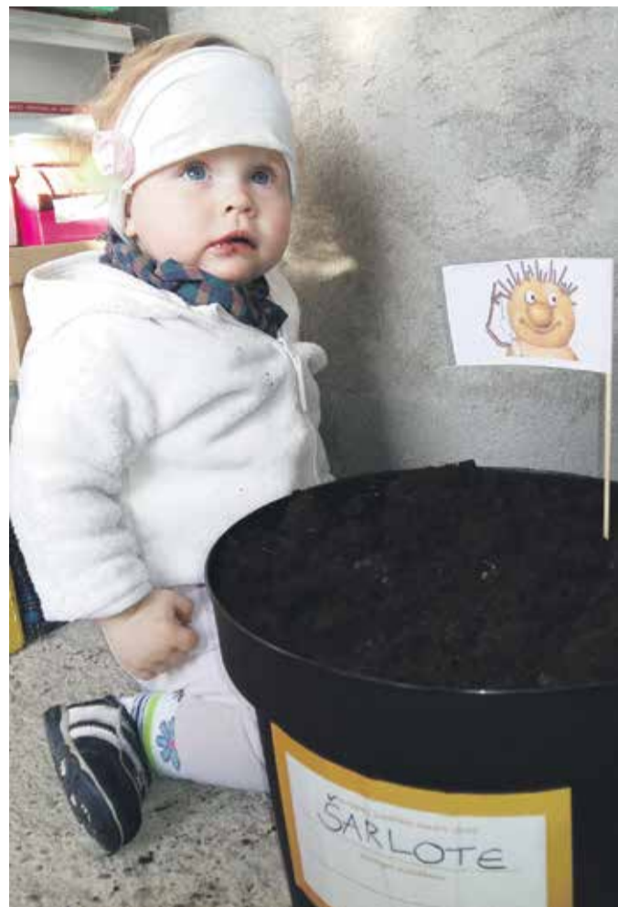
Tagad arī gadu vecā Šarlote apņēmusies rūpēties un podiņā audzēt kartupeli.

Katra ģimene saņēma podu kartupeļa audzēšanai un pirmo kartupeli jeb „ciltstēvu”, ko iestādīja jūnija sākumā. Ģimenes noklausījās arī īsu lekciju par projektu, saņēma karodziņu, kas simbolizē iesaisti tajā, un tad devās ārpus Sociālā dienesta, lai iestādītu kartupeli puķpodā. Par stāda labsajūtu jārūpējas no jūnija līdz oktobrim. Kartupeļa aktivitātes augšanas procesā ir jāfotografē, tādēļ līdz rudenim no „Kartupeļu brālības” biedriem tiek gaidītas fotogrāfijas, lai redzētu, kā kartupelis podā aug un attīstās.