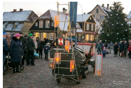
TukkersConnexion (Nīderlande) 1.decembrī ar performanci Laternas