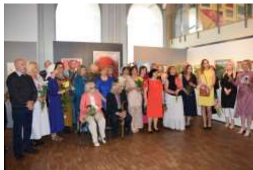
TTMS Kuldīgas paleta 50.jubilejas kopizstādē