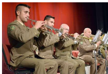
Spēlē Spānijas Operacionālo kaujas nodrošinājuma spēku orķestris