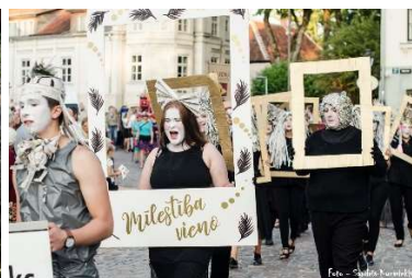
Gājiens laikraksta Kurzemnieks darbinieki