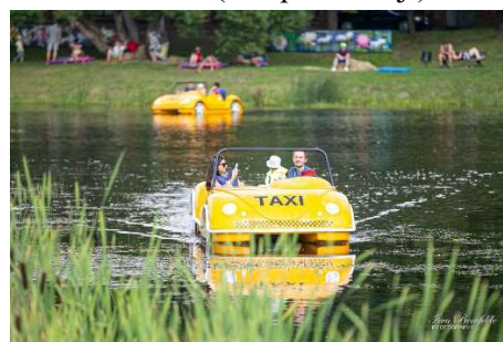
Autokatamarāni Māras dīķī