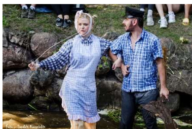
Aleksūpītes karnevāla uzvarētāji