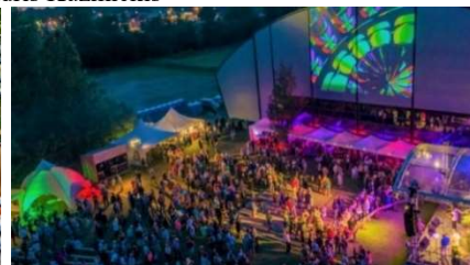
Nakts pie Māras diķa