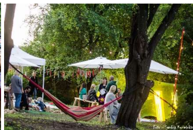
Atpūta Baltās mājas pagalmā (Kaļķu 3)