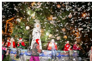
Ar konfeti salātu svētku egli iedegta