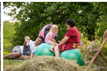
Atpūta bez viedierīcēm

Divas reizes gadā no SIA Superparks tiek nomāti un bērniem bez maksas nodrošināti karuselīši: Hercoga Jēkaba gadatirgū Pilsētas dārzā Zirdziņi , bet Ziemas festivālā Notīci brīnumam – Retrovilcieniņš Liepājas ielā.