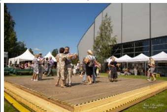
Šlāgerballe pie Māras dīķa