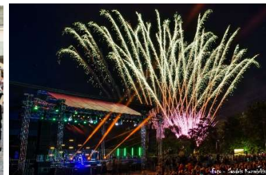
Svētku salūts estrādē

Lai uzzinātu apmeklētāju viedokli par 2019. gada Dzīrēm , no 19.jūlija līdz 23.augustam norisinājās iedzīvotāju aptauja, kurā piedalījās 1079 cilvēki. 1019 aptaujas anketas aizpildīja internetā, bet 60 papīra formātā. Vairākuma aptaujāto viedoklis – pārmaiņas bija vajadzīgas, iesāktais jāturpina, apzinot un novēršot kļūdas, turpinot meklēt jaunas idejas un, iespējams, apdzīvot jaunas teritorijas. Par pozitīvām pārmaiņām sauc 25% aptaujāto, bet 47% uzskata, ka bija labi, tomēr uzlabojumi vajadzīgi. Kategoriski pret jauninājumiem ir 19%. Daļai pietrūcis ierastā atklāšanas pasākuma. Viņi ierosina, ka tā tomēr varētu būt ceturtdienas vakarā.