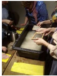
Top kaņepju papīrs