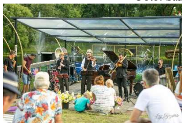
Māras diķa Mazā skatuve