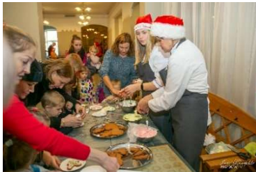
Piparkūku glazēšana aizrauj gan lielus, gan mazus