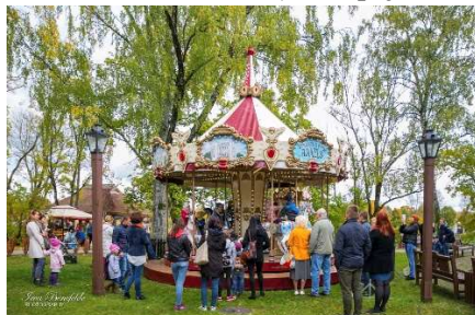
Zirdziņi Pilsētas dārzā

Divas reizes gadā no SIA Superparks tiek nomāti un bērniem bez maksas nodrošināti karuselīši: Hercoga Jēkaba gadatirgū Pilsētas dārzā Zirdziņi , bet Ziemas festivālā Notīci brīnumam – Retrovilcieniņš Liepājas ielā.