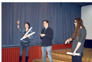
Tikšanās KKC kino zālē 8.februārī

KKC kino zālē 2018./2019.gadā ir izrādītas visas filmas, kas tapušas Nacionālā kino centra (NKC) programmā Latvijas filmas Latvijas simtgadei .