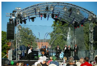
Diksilends Sapņu komanda