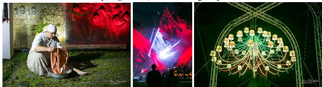
5. Mākslu kaleidoskops Uguns (un) Nakts