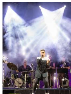
Grupai Instrumenti koncerts Kuldīgas estrādē pulcēja 3773 apmeklētājus