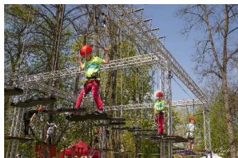
Virvju trase Pilsētas dārzā