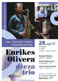
E.Olivera džeza trio koncerta plakāts