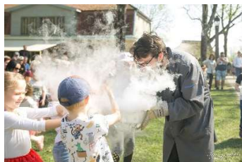
Eksperimentu šovs Pilsētas dārzā

Dzīru laikā pie Māras dīķa un Hercoga Jēkaba tirgū darbojās Kalvenes trušu muižas Trušu parks . 20.jūlijā tika sarīkots pasākums Atpūta bez viedierīcēm Sienāžu pļavā , turpat varēja darboties ar Bau Bau lielizmēra konstruktoriem.