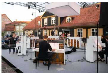
Skatuve No.777 Rātslaukumā

Par godu Kuldīgas 777.gadadienai Rātslaukumā uz Skatuves No.777 valdīja septiņas klavieres. Pie tām varēja sēsties ikviens, bet īpašos laikos septiņi jauni mūziķi atskaņoja šim notikumam radīto Marikas Šaripo skaņdarbu. Lielu interesi radīja Latvijas Antīko automobiļu kluba spēkratu brauciena Retromance izstāde Pilsētas dārzā. Dzīru laikā varēja ielūkoties arī vecpilsētas aizkulisēs - seno namu Liepājas ielā 8 un Kaļķu ielā 3 pagalmos. Tradīcijas turpināt ir svarīgi, tāpēc arī šajās Dzīrēs notika Aleksūpītes skrējieni, Aleksūpītes karnevāls, kā arī humora pilnais svētku gājiens cauri visai pilsētai, kas noslēdzās ar lielo balli un salūtu estrādē.