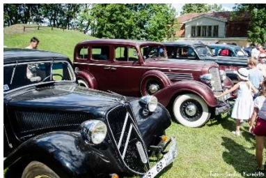
Retromance Pilsētas dārzā