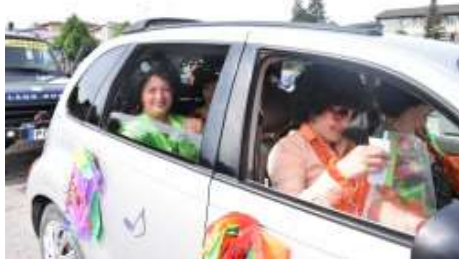
Dullā maijvabole izlido no Pilsētas laukuma