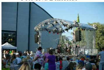
Māras diķa Lielā skatuve