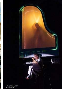
Levitējošās klavieres (Spānija)