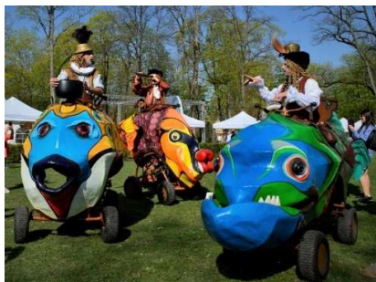
TukkersConnexion (Nīderlande) 27. aprīlī ar performanci Z.I.V.I.S.

1.decembrī 16.Ziemas festivālā Notīci brīnumam! ar performanci Laternas viesojās ielu teātris TukkersConnexion (Nīderlande).