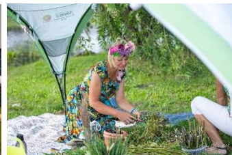
No rīta espreso līdz pēcpusdienas tējai

KKC rīko arī amatiermākslas kolektīvu izklaides pasākumus, kas parasti notiek pēc draudzības koncertiem vai nozīmīgu jubileju reizēs. KKC telpas saviem izklaides pasākumiem labprāt izvēlas arī citas iestādes, biedrības un firmas.