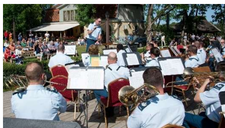
Kanādas Bruņoto spēku Centrālā orķestris koncertē Pilsētas dārzā