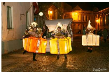
Ar Sapņu karieti dāvanu pavadībā Rātslaukumā ieradās Ziemassvētku vecītis