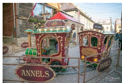
Retrovilcieniņš Liepājas ielā