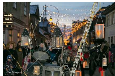
Performance Laternas Rātslaukumā