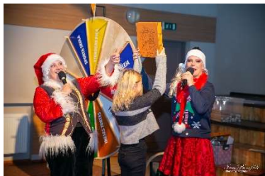
Laimes rats allaž ir ļoti gaidīts