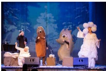
Koncertuzvedums Ezītis sniegā