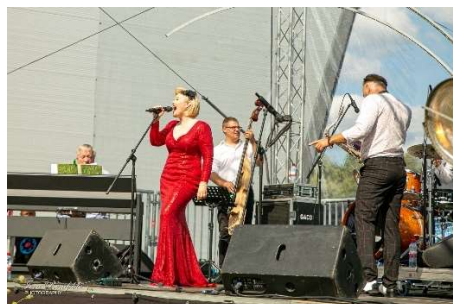
Diksilends Memeland (Lietuva)