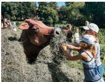
Izklaide mazajiem piknikotājiem