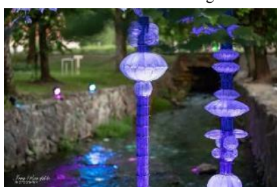
Trauslais miegs Alekšupītē