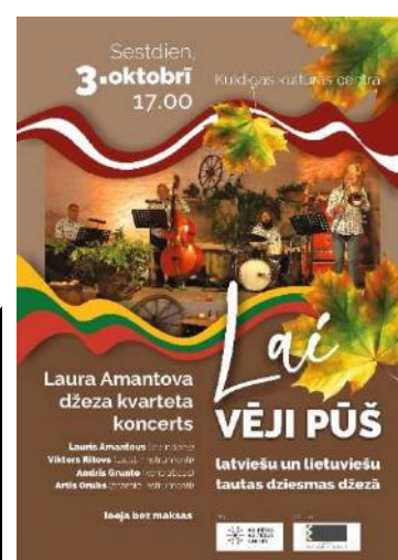
3. oktobra koncerta afiša Projekts Lai vēji pūš