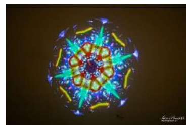
Emogrāfa radītā sirdspukstu mozaīka