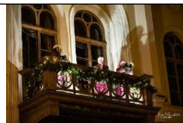
Rūķu orķestris uz Domes balkona