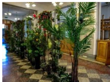
Plūsmas regulējoša siena KKC foajē