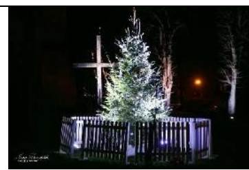
Eņģeļu koris pie Sv. Annas baznīcas