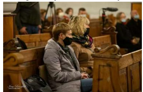
Koncerta klausītājiem pirmo reizi sejas maskas obligātas