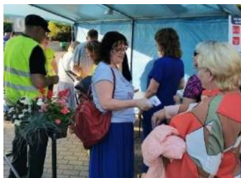
Bezkontakta termometri pasākumā