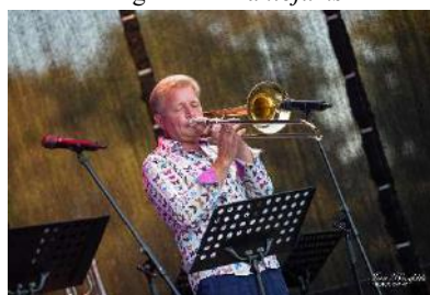
Programma Trombomānija