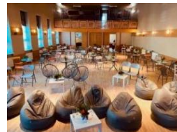
Zāles iekārtojums 30.08.20. koncertā