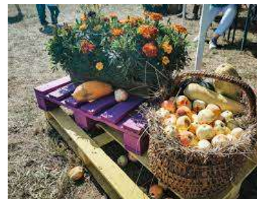
Noformējums vienmēr pārdomāts