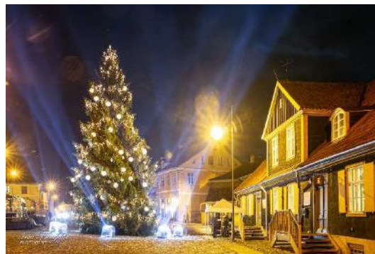
Iedegta Kuldīgas egle Rātslaukumā