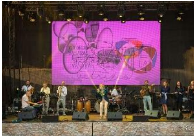
Piekdienas vakara muzikālais kokteilis