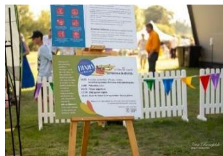
Informācija pasākuma apmeklētājiem