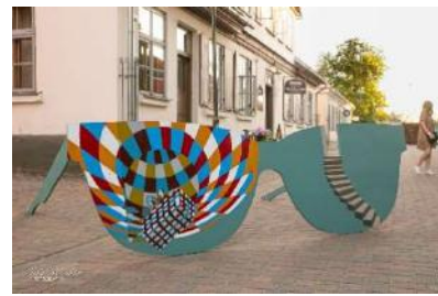
Liepājas ielā bija apskatāmas dažādu mākslinieku veidotas lielformāta brilles