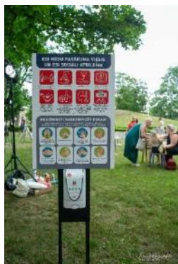
Pārvietojami dezinfekcijas stendi