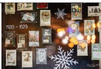
Kartīšu izstāde Metropoles logos