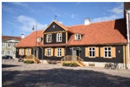
Vecais Rātsnams

2020. gadā nenotika neviens maksas pasākums, līdz ar to nebija arī ieņēmumu (attiecīgi 2019. gadā 16 maksas pasākumus apmeklējuši 163 dalībnieki, ieņēmumi 1 112,00 EUR, 2018. gadā 26 maksas pasākumus apmeklējis 231 dalībnieks, ieņēmumi 1 832,00 EUR; 2017. gadā – 243 dalībnieki, ieņēmumi 841,00 EUR.).