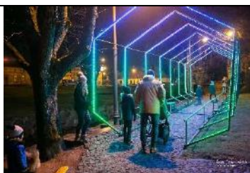
Gaismas vārti Strautu ielas skvērā