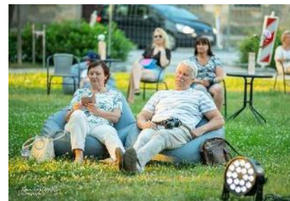
Mūzika labam garastāvoklim – skatītāji