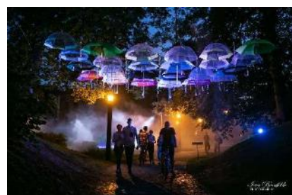
Lietusvīriņa nedarbi naktī