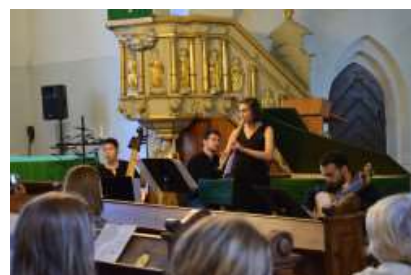
Senās mūzikas grupa Caladrius (Vācija) koncertē Sv. Katrīnas baznīcā