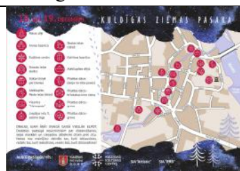
Pastaiņas ceļvedis - karte

Ziemas festivālu, kuru ārkārtējās situācijas laikā rīkot nedrīkstēja, 18. un 19. decembrī aizstāja jauns notikums Ziemas pasaka – nesteidzīgi ejama sajūtu taka ar 15 pieturām no Māras diķa gar Alekšupītes krastiem cauri vecpilsētai līdz Pilsētas dārzam ar katrai vietai īpaši veidotu muzikālu noformējumu. Māras diķī atspīdēja teiksmaina ziemas aina ar gaismas tiltiem, zvaigznēm un krāšņu dižegli pašā centrā. Sv. Annas baznīcas dārzā skanēja ērģeles un eņģeļu koris, uz kultūras centra sienas varēja sekot sniegpārslu dejām, Strautu ielas skvērā iziet cauri Gaismas vārtiem. Alekšupīte, tērpusies greznās svētku rotās, vilināja baudīt Ziemeļu Venēcijas burvību. Viesnīcas Metropole logos spoguļojās vesels gadsimts, atklājot Ziemassvētku un Jaunā gada apsveikuma kartīšu kolekciju, bet Liepājas ielas mākslas salona skatlogā varēja pētīt dažādu laiku eglīšu rotājumus. Tālāk ceļš veda pār Skolas ielas gaismaskritumu , līdz Alekšupītes diķim ar eglīšu disko regāti un Sv. Katrīnas baznīcas neparasto starojumu. Pilsētas dārzā varēja sastapt kā straujus briežus garām paskrējušos gada 12 mēnešus, uz brīvdabas kino ekrāna uzburt sveicienu sev mīļiem un svarīgiem cilvēkiem un caur lāzera iluminācijas zibšņiem gravā ieiet tieši ziemā. Izdevās skaisti.