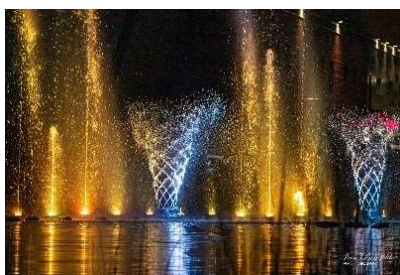
Muzikālas strūklakas viskrāšņākās bija vakaros, kad satumsa