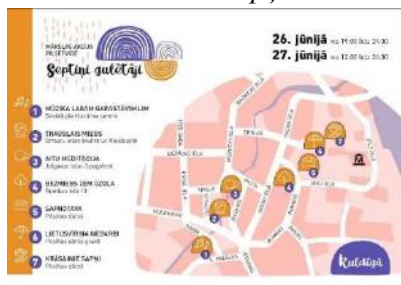
Grafiskais dizains. Autore Līga Dzene