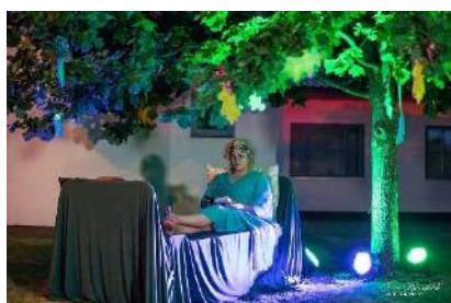
Bezmiegs zem ozola . Dzejas lasījumi.