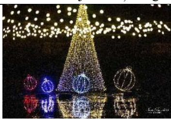
6 m augsta egle Māras diķī