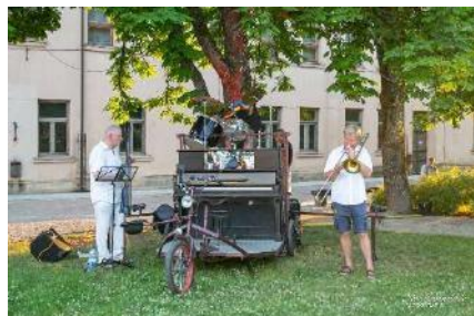
Mūzika labam garastāvoklim - mūziķi