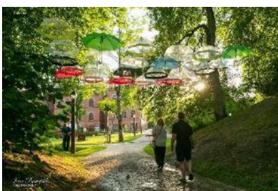
Lietusvīriņa nedarbi dienā