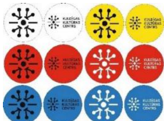
Apmeklētāju kontroles taloni