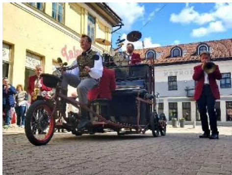
4. maijs. Braucošās klavieres Liepājas ielā

Ziemas festivāls Notici brīnumam 5. decembrī nevarēja notikt, bet 29. novembrī (ārkārtējās situācijas laikā) KKC nodrošināja Kuldīgas egles iedegšanu Rātslaukumā nepulcējoties.