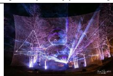
Artistic lāzertiluminācija Pilsētas dārzā