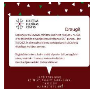
Info par to, ka kultūrvietā slēgta