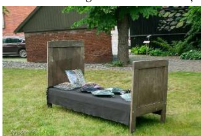
Trauslais miegs . Stikla māksla skvērā