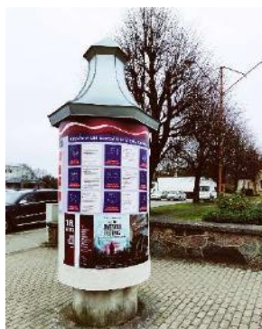
Informācija uz afišu stabiem