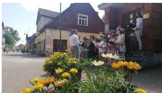
21. jūnijs. Kamerkoris Rāte ielīgo Liepājas ielā

Ziemassvētku laikā atkal valstī bija izsludināts ārkārtas stāvoklis, kas nepieļāva publisku pasākumu rīkošanu.