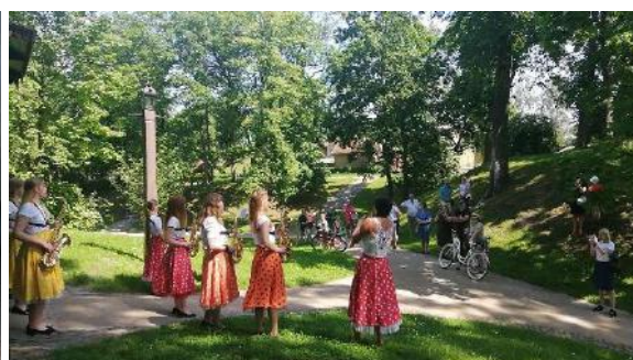
Saksofonistu ansamblis spēlē Pilsētas dārzā