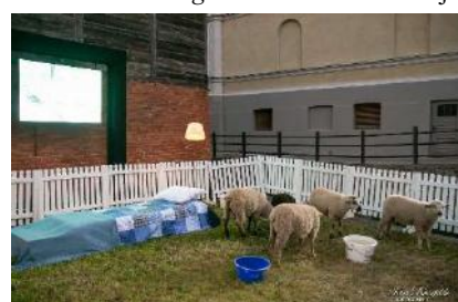
Aitu meditācija . Ja nenāk miegs, skaiti ...