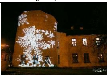
Sniegpārslu dejas uz KKC fasādes