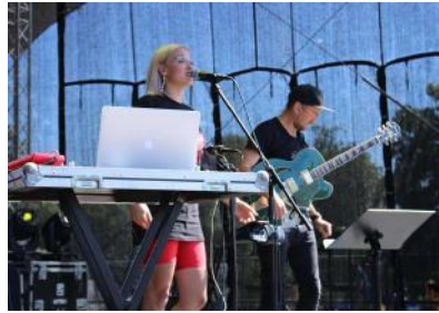
Koncertu sērija Ko tu jaunam padarīsi