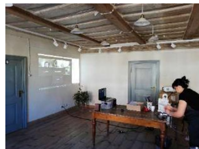
04.05. Pirmā meistarklase Zoom