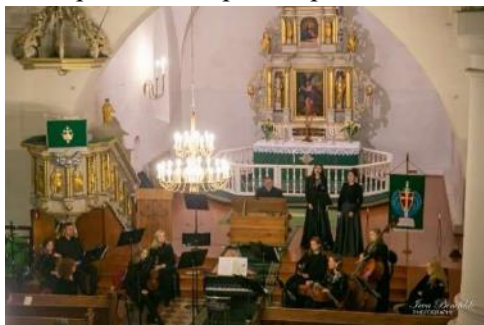
Hercogam Jēkabam 410. Collegium Musicum Riga

Organizējot šo koncertu, KKC speciālisti atkal guva jaunu pieredzi, jo šis bija pirmais bezmaksas koncerts ārpus KKC telpām ar personalizētām sēdvietām un obligātām sejas maskām skatītājiem.