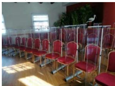
Distancēšanās statīvi kora mēģinājumam