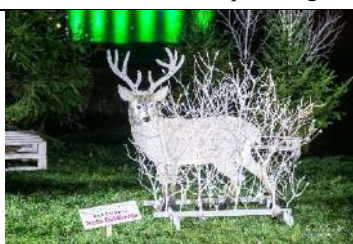
Briedis Decembris Pilsētas dārzā