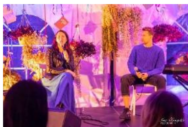
Dzejas telpa Liepājas ielas vidū