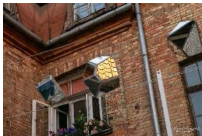
Stikla mākslas izstāde vidē Spārni un mākoņi