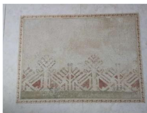
Oriģinālais sienas gleznojums teātra telpā