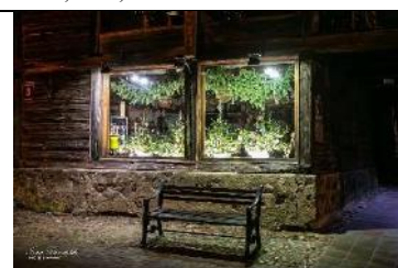
Eglīšu rotājumi Liepājas ielas 3 logos