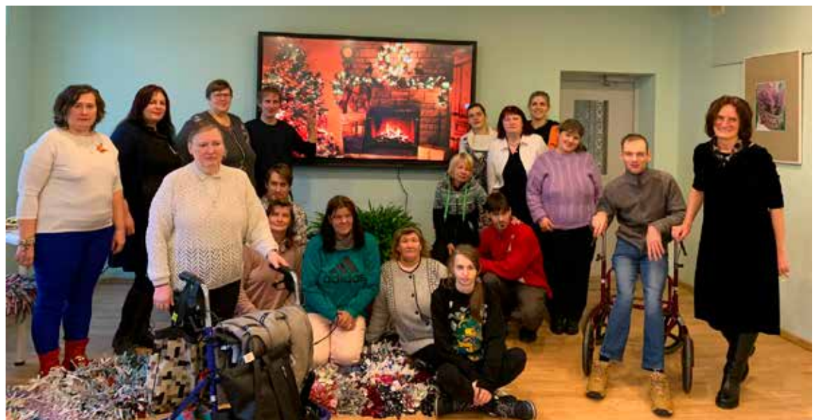
Projekta dalībnieki Kuldīgas novada pašvaldības aģentūrā "Sociālais dienests" tikās noslēguma pasākumā, kuru organizēja biedrība "Gaišo domu platforma".

Projektā piedalās vēl trīs partneri no Latvijas un Lietuvas: Kurzemes plānošanas reģions, Kretingas dienas aktivitāšu centrs un Raseiņu dienas aprūpes centrs. Kopīgi tiek īstenots mērķis – attīstīt cilvēku ar invaliditāti prasmes, veicināt izpratni par viņu spēju iesaistīties darba tirgū un būt