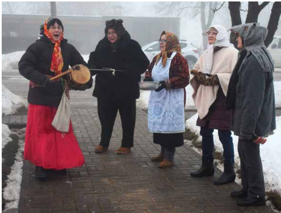
Ziemas saulgriežos nīkrācniekus ar skanīgām tautasdziesmām priecēja Rudbārzu pagasta folkloras kopa "Kamenītes".

Šogad Nīkrāces pagasta svētku eglītes iedegšana notika ļoti zīmīgā laikā – tieši Ziemas saulgriežos – laikā, kas latviešiem vienmēr ir bijis īpaši svarīgs, jo diena, kaut tikai par mazu brīdi, paliek garāka un tumsa lēnām sāk atkāp-