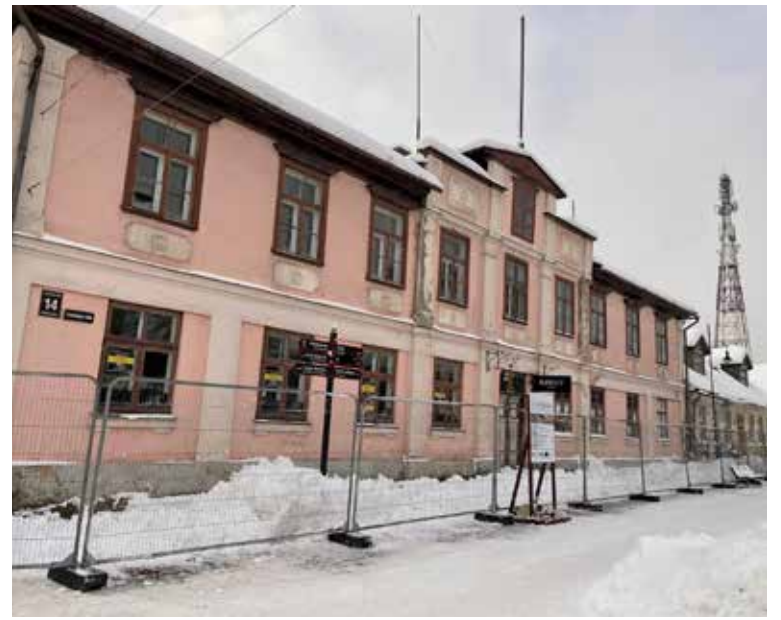
Decembra sākumā uzsākti būvdarbi objektā Liepājas ielā 14, Kuldīgā. Tos plānots pabeigt šī gada beigās.

VELGA SILIŅA, Kuldīgas attīstības aģentūras projektu vadītāja